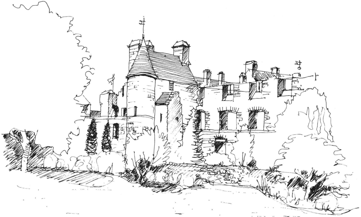
Falkland Palace, Zeichnung von Max Müller, Lachen