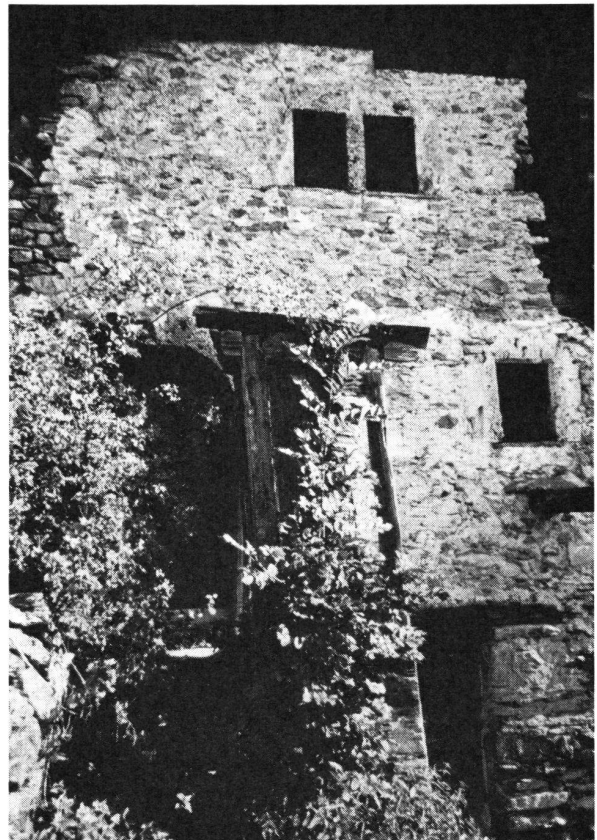
2. Der erhöhte, ursprünglich einzige Hauseingang mit dem romanischen Rundbogen.