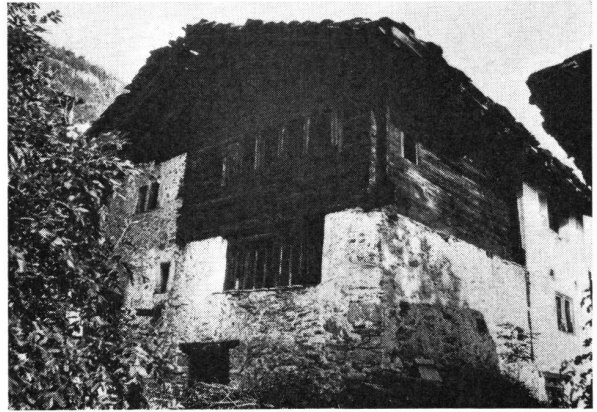
1. Der einstige Wohnturm von Burgen aus Südosten.

Eine kleine Gruppe von Objekten, die besichtigt wurden, entstammte schliesslich dem 18. Jahrhundert. In breit sich schwingender barocker Anlage den Architekturideen der absolutistisch-fürstlichen Ära verpflichtet (Schloss Hopetoun in der Nähe der Forth-Brücken) oder aber bereits dem Klassizismus zugeordnet (Haddo-house im Norden und Mellerstain-house im Süden des Landes), vermochten die drei von der berühmten Baumeisterdynastie Adam entworfenen Landsitze allesamt vom baulichen Elan und mit ihren Schätzen vom Sammeleifer und von der Ausstattungsfreude ihrer Besitzer in einer Blüteepoche zu zeugen. In der ganzen Serie von trutzigen Festungswerken und machtvollen Schlössern setzten sie damit gewissermassen das Tüpfchen auf das i.