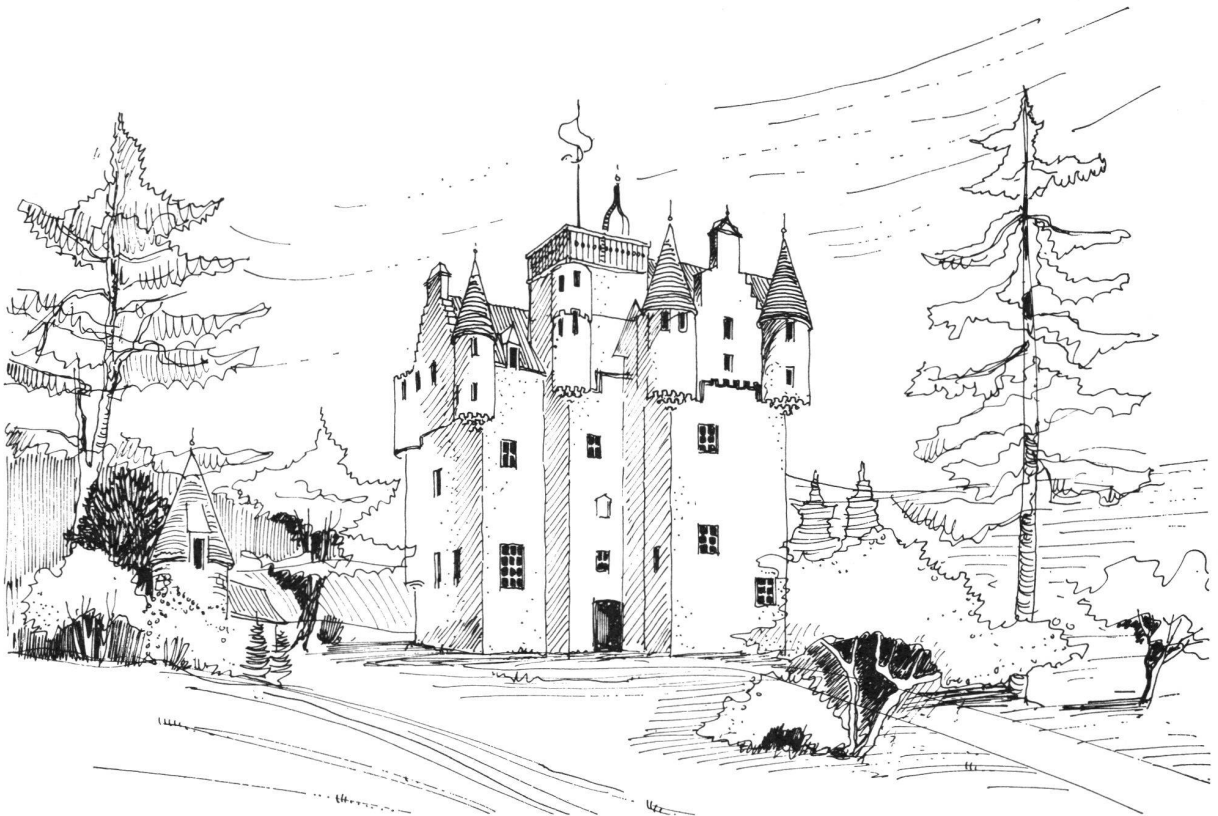
Craigievar Castle, Zeichnung von Max Müller, Lachen