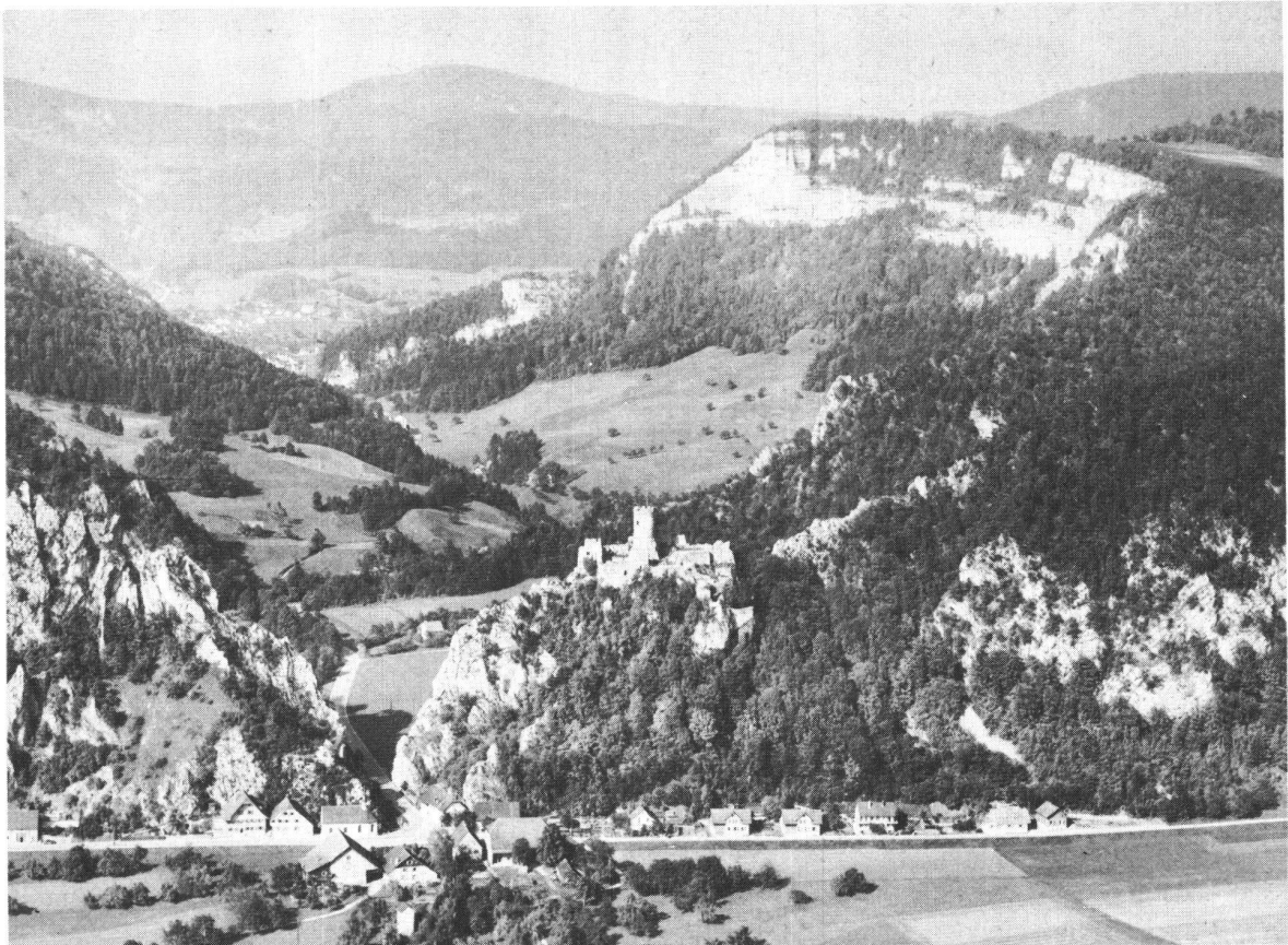
Einheit von Burg und Juralandschaft: Neu-Falkenstein über dem Ausgang der Klus von Mümliswil.

Schloss Aigle, mittelalterliche Burg in der Reblandschaft. Die Anlage birgt heute ein Rebbau- und Salzmuseum.