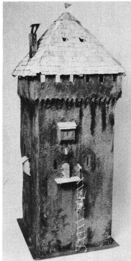
Idealkonstruktion eines Wohnturms von vorne (1. Preis des Jugendwettbewerbes)

Erscheinen jährlich sechsmal 50. Jahrgang 1977 10. Band Sept./Okt. Nr. 5