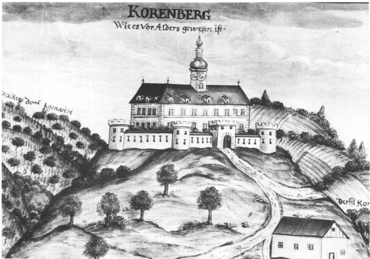
Kornbach bei Feldbach.

In der gotischen Katharinenkapelle des Südtraktes sind Fresken des 14. Jahrhunderts freigelegt worden. Die Weinproben in den gewaltigen Kellergewölben waren nicht weniger genussreich als die baugeschichtlichen Eindrücke.