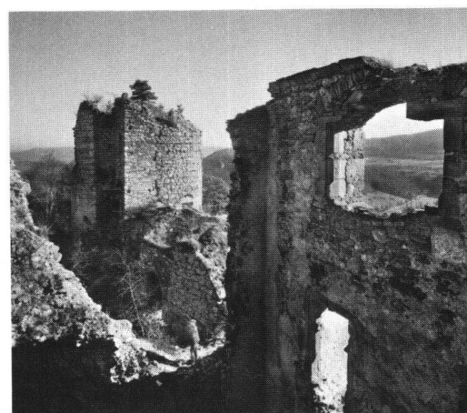
Landskron. Jahrelang haben sich die «Burgenfreunde» vergeblich um die Restaurierung der imposanten Ruine bemüht