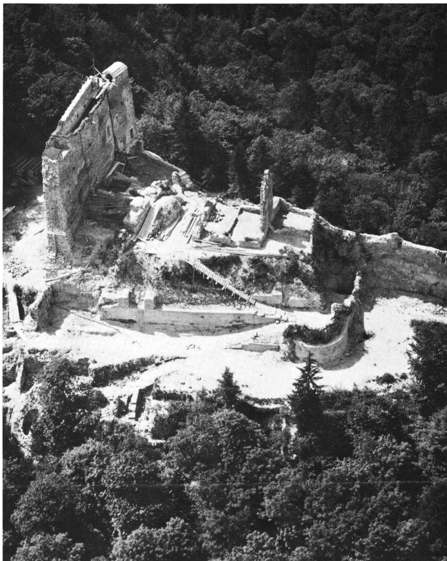
Farnsburg. Luftaufnahme während der von den «Burgenfreunden» unterstützten Restaurierungsarbeiten ▶