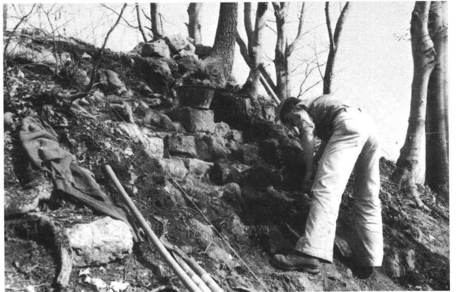
Altenberg BL, Freilegung des Mauerwerks in Schnitt F10.

pauschalen urkundlichen Nennung schwer fassbaren Burgengründungen des Bischofs Burkart von Fenis († 1107) gehören könnte 10 . Diese Anlagen sind während des Investiturstreites entstanden und dürften im 12. Jahrhundert wegen des Überganges der bischöflichen Herrschaftsrechte an regionale Machthaber hochadligen Standes bald wieder eingegangen sein 11 . Abschliessende Aussagen sind in dieser Frage selbstverständlich noch nicht möglich. Dass eine Weiterführung der Grabungen auf dem Altenberg von höchstem burgenkundlichem und historischem Interesse wäre, dürfte durch die bisherigen Forschungsergebnisse hinlänglich klar geworden sein.