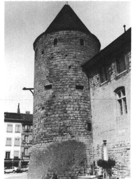
▲ Schloss Yverdon VD, einer der Ecktürme