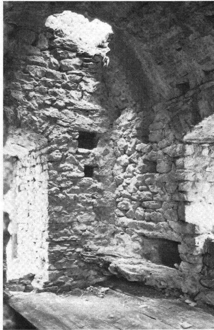
San Vittore GR.

Das Vorhandensein einer Tankzisterne 15 auf dieser Burg ist an sich nichts Ungewöhnliches. Diese Art der Wasserversorgung auf Burgen ist in unseren südlichen Alpentälern und im Wallis durchaus der Normalfall, findet sich auch häufig in Nord- und Mittelbünden und wenigstens vereinzelt im Jura (Frohburg SO, Riedfluh BL). Merkwürdig sind aber Lage und Kleinheit der Vorrichtung.