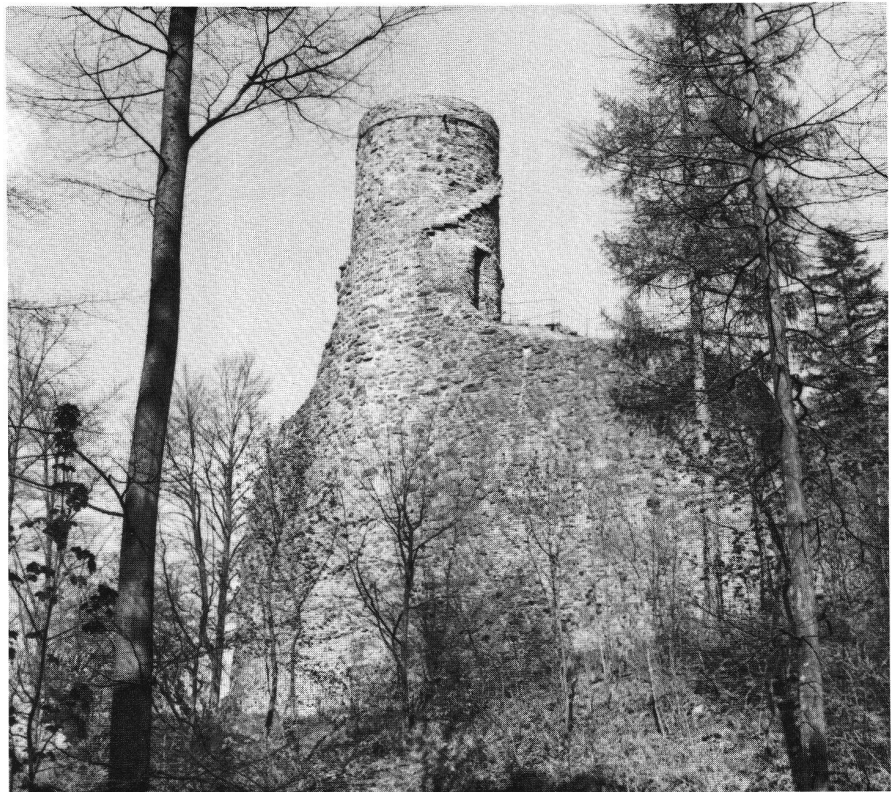
Bärenfels D, Blick auf Schildmauer und Rundturm.

Der hochmittelalterliche Burgenbau setzte im Gebiet von Rheinfelden wohl noch vor der Jahrtausendwende ein. Eine frühe Holz-Erdburg ist bei Herten am «Hirschenleck» nachgewiesen, und eine schöne Motte aus der Jahrtausendwende erhebt sich am Nordrand des Dorfes Schupfart. Ebenfalls in die Wende vom 10. zum 11. Jahrhundert muss die kürzlich ausgegrabene Burgstelle Altenberg bei Füllinsdorf datiert