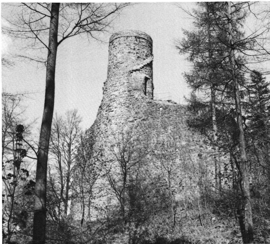
Bärenfels D, Blick auf Schildmauer und Rundturm.

Der hochmittelalterliche Burgenbau setzte im Gebiet von Rheinfelden wohl noch vor der Jahrtausendwende ein. Eine frühe Holz-Erdburg ist bei Herten am «Hirschenleck» nachgewiesen, und eine schöne Motte aus der Jahrtausendwende erhebt sich am Nordrand des Dorfes Schupfart. Ebenfalls in die Wende vom 10. zum 11. Jahrhundert muss die kürzlich ausgegrabene Burgstelle Altenberg bei Füllinsdorf datiert