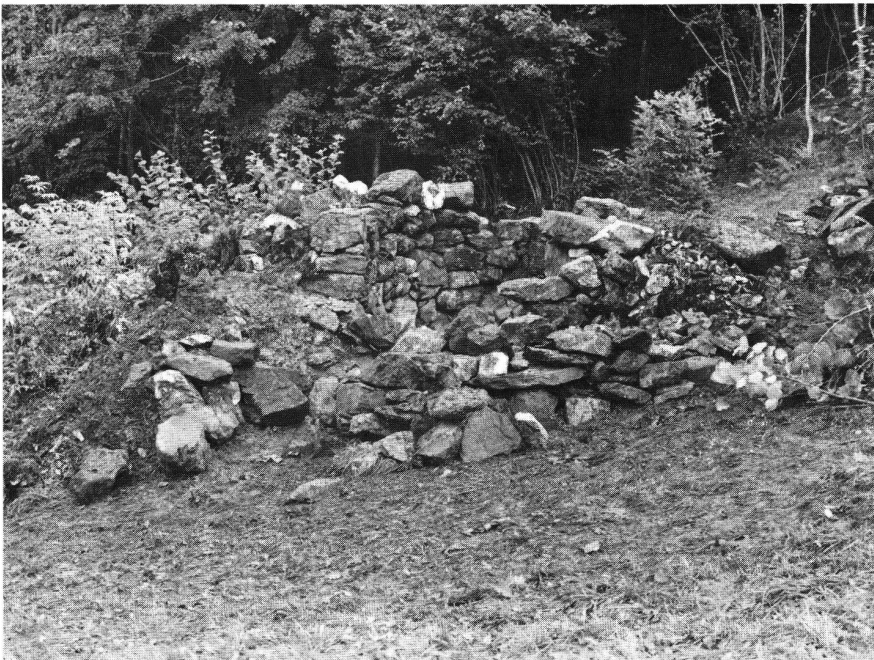
Abb. 5: Kalkofen Isenthal UR. Ansicht des Ofens von Westen. Der Ofen ist zur besseren Isolation in den Abhang hineingebaut.

Die angeführten Gründe führen deshalb zur Vermutung, dass im alpinen und voralpinen Raum der Kalkofen beim Burgenbau nicht auf dem Bauplatz selbst, sondern in der näheren oder weiteren Umgebung zu suchen ist.