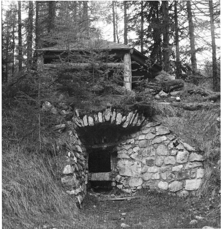
Abb.2: Kalkofen von Fuldera GR. Dieser Kalkofen war noch bis um 1930 in Betrieb und kann heute als konservierte Ruine besichtigt werden. Unten die Feuer- und Schüröffnung (Schnauze), oben das Schutzdach über dem Ofen.

Der typische Feldkalkofen (vgl. Abb.4) hat einen runden oder leicht ovalen Grundriss, der Innendurchmesser der Kalk- und Feuerkammer beträgt 2–4 m und hat eine Höhe von 2–4 m. Das ergibt ein Brennkammervolumen von 6–25 m 3 , was 9–37,5 t rohen Kalksteins entspricht. 6 Das Mantelmauerwerk besteht wenn möglich aus kristallinem Gestein und hat eine durchschnittliche Mächtigkeit von 1 m. Das Mauerwerk ist in der Regel trocken aufgeschichtet, damit die Steine sich durch Hitzeeinwirkung bewegen können. Fugen und Hohlräume werden mit Sand gefüllt. Der Ofen ist oft zur besseren Isolation in einen Abhang hineingebaut, so dass nur die Ofenbrüst mit der Schnauze (Feuer- und Schürloch) freiliegt (vgl. Abb.5 und 6). Der eingangs erwähnte Kalkofen der Löwenburg war in die äussere Grabenwand des Halsgrabens eingehauen und hatte einen Durchmesser von 3 m und war rund 2,5 m hoch, was ein Kalkkammervolumen von rund 9,4 m 3 ergibt.