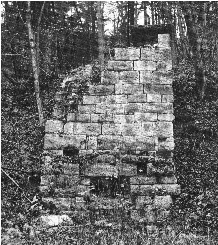
Abb. 3: Schachtkalkofen von Rickenbach SO. Der Ofenmantel besteht aus sorgfältig gefügten Kalksteinquadern; das Ofeninnere ist mit Schamotsteinen ausgefüllt.

Die Kalkulation der Idealburg ergibt 2420 \text{ m}^3 Bruchsteinmauerwerk. Ein Drittel dieses Volumens ist als Kalkmörtel zu betrachten, was etwa 810 \text{ m}^3 Mörtel bedeutet. Nun besteht ja Kalkmörtel nicht nur aus Branntkalk, sondern ist eine Mischung von gebranntem Kalk und Sand, eventuell noch weiteren Zusätzen, die wir hier jedoch nicht beachten wollen. Gerade das Mischungsverhältnis von Kalk und Sand ist sehr stark abhängig von den örtlichen Gegebenheiten des Sandes (Grob- und Feinteile), so dass kein allgemeingültiges Mischungsverhältnis bestimmt werden kann. Mörteluntersuchungen an Südbündner Bauten haben z.B. ein Mischungsverhältnis von 1:5,5 bis 1:13 je nach Sand erbracht. 8 Römi-