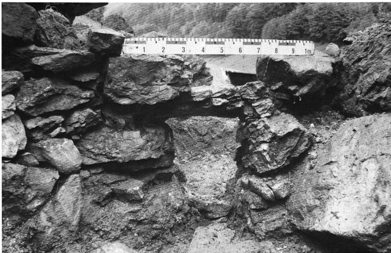
Abb. 6: Kalkofen Isenthal UR. Schmale Schür- und Feueröffnung (Schnauze).