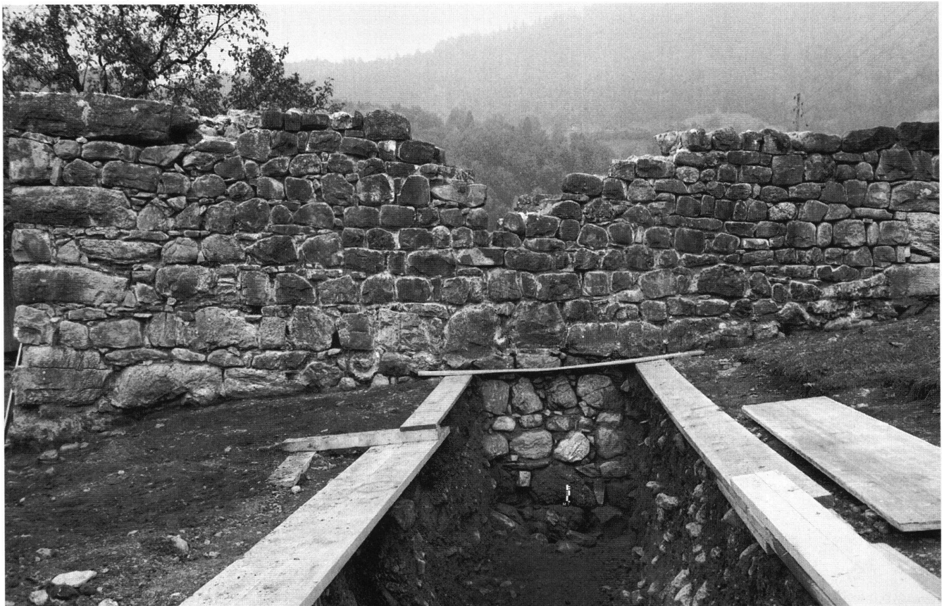
Abb. 1: Turmruine im Kleinteil, Mauer M 1 von Osten mit dem an die Mauer anschliessenden Schnitt S 1.