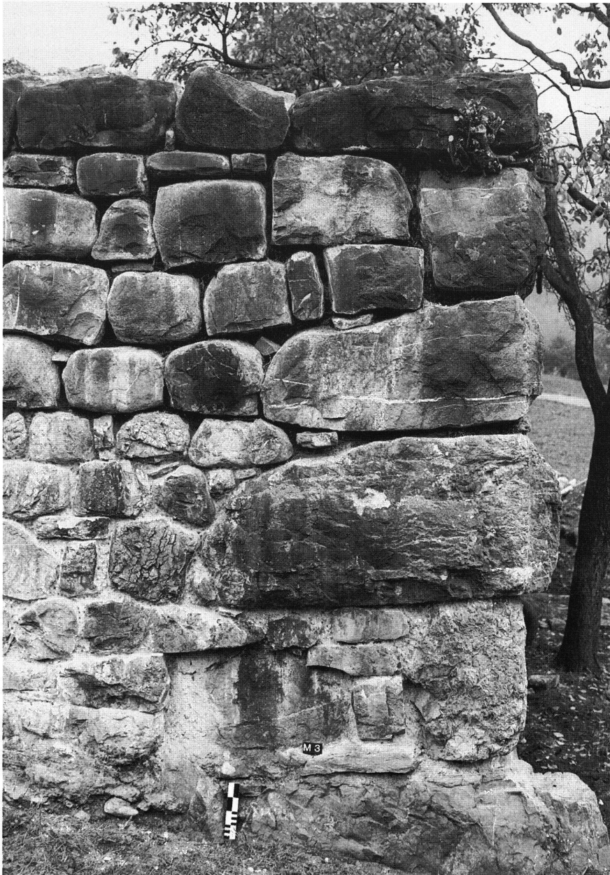
Abb. 4: Turmruine im Kleinteil, östliche Ecke der Mauer M 3. Die drei untersten Ecksteine sind original, während die drei oberen 1936 hinzugefügt worden sind.

Schadensbild, wie wir es am Innenmantel der Nordseite antrafen. An dieser Stelle hatte die mehr als armdicke Pfahlwurzel einer Pappel den Mauer mantel bis in den Fundamentbereich hinunter vom Mauerkern abgesprengt. Auch auf der Westseite hatte das Wurzelwerk eines anderen Baumes derartige Schäden hinterlassen, dass der Mauermantel nicht mehr zu retten war. Tatsache ist, dass das Wurzelwerk seit 1936 einen grossen Teil des originalen Mauerwerks endgültig zerstört hat.