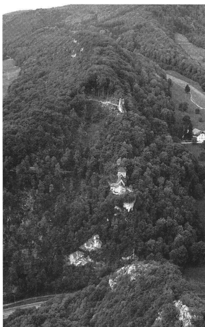
Vorbourg, vue aérienne des châteaux, 1995.

appeler Telsberg. Et si on emploie le mot Vorbourg, c'est pour désigner les environs des châteaux. En 1417, la chapelle Saint-Imier est sise dans le château inférieur de Telsperg (inferiori castro de Telsperg) et près de cette chapelle il y a un village qui s'appelle Suburbium dit Vorburg de Telsperg. En 1423, on place le Vorbourg (Vorburg) au-dessous de la forteresse supérieure de Telsberg (obern Vesten Telsperg), et on place la forteresse inférieure de Telsberg (undern Burg Telsperg) dans le ban du Vorbourg (Vorburg). En 1460, devant le château inférieur de la ville de Delémont (undern Schlosses der Statt Telsperg), on trouve un village et, sous le château, on a le droit de pêcher dans la Birse. En 1476, il y a une maison en-dessous de la forteresse inférieure nommée Telsberg (nyddern vestin genant Telsperg) et il y a des jardins au Vorbourg (in der Vorburg).