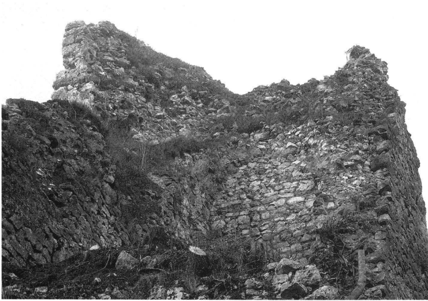
Château de Vorbourg, maçonnerie du château supérieur.