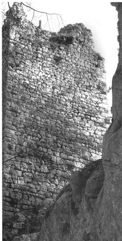
Château de Vorbourg. Tour principale du château supérieur.

En 1586, le lundi de Pâques, au milieu des ruines du château inférieur de Telsberg, la chapelle du Vorbourg, restaurée, fut bénie à nouveau, et dédiée à Dieu tout-puissant, à la Bienheureuse Vierge Marie, à saint Michel archange, aux saints Imier et Othmar... «Notre Dame du Vorbourg, du haut de votre sanctuaire, depuis des siècles vous protégez notre Jura.» Il y a bien longtemps que ce ne sont plus les châteaux de Telsberg qui protègent la vallée.