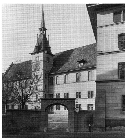
4: Ancienne Académie. Construite entre 1579 et 1587 sur le mur d'enceinte de la Cité; elle abritait le premier établissement de théologie réformée en langue française, fondé dès 1537. – 1579–1587 errichtet auf der Umfassungsmauer der Cité; in der Alten Akademie befand sich seit 1537 das erste französischsprachige Institut für reformierte Theologie.