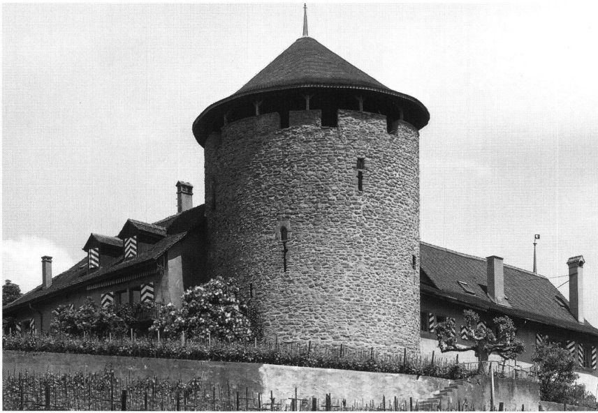
11: La tour de Bertholod (Commune de Lutry). Mentionnée dès 1312, elle présente un plan exceptionnel en arc de cercle outrepassé avec un côté plat. – 1312 erwähnt. Der Turm ist auf der Wehrseite halbrund und auf der Rückseite flach ausgestaltet.

chaussée est complètement fermé, l'entrée originelle s'ouvrant au premier étage. Les corps de bâtiment adjacents étaient à l'origine également percés d'archères et en partie crénelés. À l'exception du plan de la tour, ailleurs circulaire et dans la règle carré, comme au château de Montagny, à la Tour de Marsens (Fig. 10) ou au Clos des Moines, Bertholod constitue l'archétype des nombreux châteaux et maisons fortes du Lavaux: un élément de défense, qui peut remonter aux XII e –XIII e siècles, protégeant des bâtiments d'habitation et d'exploitation vinicole (Fig. 11), souvent élégamment modernisés dans le style gothique tardif. Intégrés en partie à la défense avancée d'une ville comme Lutry, ils prennent ailleurs valeur de petite forteresse assurant sa propre défense. L'extrémité du territoire de l'évêque, à Saint-Saphorin, bourg fermé par deux portes, est verrouillée par le château de Glérolles, avec une tour maîtresse datée de 1248 15 , à bossage dans sa partie inférieure, exceptionnel pour la région; Sa hauteur a été réduite au XIX e siècle au motif qu'elle portait de l'ombre aux vignes. La belle aile résidentielle a été richement modernisée au début du XVI e siècle sous les derniers évê-