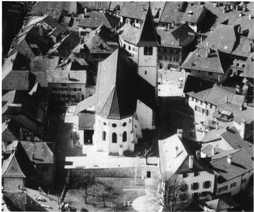
9: Le cœur de Lutry. La ville s'est développée autour d'un couvent de bénédictins, fondé au XII e siècle. – Das Städtchen Lutry entstand rund um ein Benediktinerkloster aus dem 12. Jh.

L'établissement humain remonte ici aussi à la préhistoire, comme en témoigne l'alignement de menhirs redressé sur la dalle d'un parc à voitures 9 . La monographie récemment publiée par une équipe réunie autour de Marcel Grandjean 10 a révélé l'extraordinaire richesse architecturale de la ville et de son territoire dès le Moyen Âge. La localité est attestée sous le nom de Lustriacum en 516 peut-être, en 908 en tout cas; un couvent bénédictin s'y installe au XI e siècle (Fig. 9), autour de l'église Saint-Martin, largement rebâtie en style gothique au milieu du XIII e sur un plan roman du XI e siècle, avec un extraordinaire portail de 1570 et 1578 et un somptueux décor des voûtes, peint par Humbert Mareschet en 1577. Le couvent, dont la maison vigneronne a pu être documentée 11 , se verra entouré d'un bourg au XII e siècle, fermé de murs au début du siècle suivant. Un bourg extérieur se développe à l'ouest de ce premier noyau, également fermé de murs autour de 1300. Des faubourgs se développeront encore au nord et à l'est de la ville. La défense sera renforcée par des tours érigées autour de 1300,