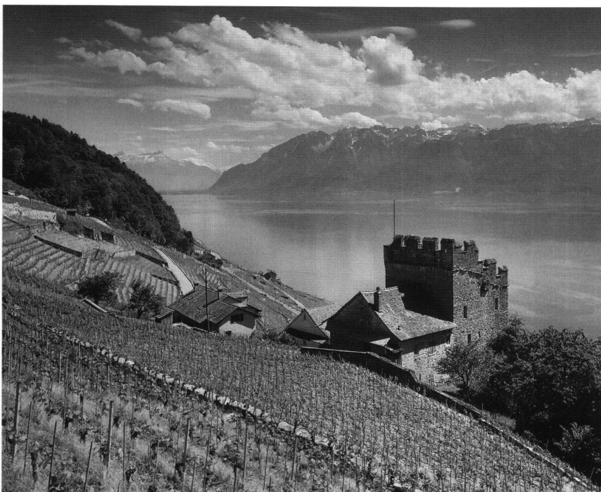
10: La tour de Marsens (Commune de Puidoux). Caractéristique des maisons fortifiée du Lavaux, elle remonte aux XII e –XIII e siècles. – Typisches Beispiel eines Festen Hauses des Lavaux aus dem 12.–13. Jh.

Ces défenses urbaines sont renforcées par un vaste réseau de tours et de châteaux, amorcé avec la tour de Gourze dès le sommet de l'adret lémanique, à près de 1000 m d'altitude. Le premier attesté est le castrum royal, mentionné dès le milieu du XI e siècle. Vraisemblablement situé au Crêt-Bernard, sur les hauteurs de Lutry, il n'en subsiste que la base d'une forte tour quadrangulaire défendant un éperon barré. Des sondages archéologiques ont mis en évidence un large fossé du côté le moins escarpé 14 . Plus au sud, à l'est de la ville, la tour des Mayor ou de Bertholod est mentionnée dès 1312; son plan en arc de cercle outrepassé avec un côté plat est exceptionnel. Le rez-de-