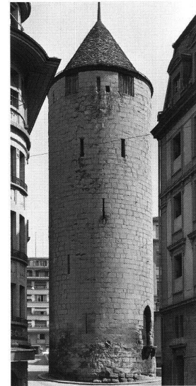
8: La tour de l'Ale. Construite en 1340 lors d'une importante campagne de renforcement des défenses de la ville, elle protégeait la porte du faubourg en contrebas. – Um 1340 im Zuge einer Verstärkung der Stadtmauern entstanden, beschützte das Tor die Vorstadt gleichen Namens.

halles et son propre hôtel de ville, attestés dès la fin du XIV e siècle et démolis vers 1870. Ces bannières se prolongeaient par des faubourgs étirés le long des principaux axes routiers; celui de l'Ale était défendu à son extrémité par une tour de plan circulaire érigée en 1340 (Fig. 8) lors d'une importante campagne de renforcement des défenses de la ville. C'est la seule rescapée de la cinquantaine de tours et de portes que comportaient les enceintes de la ville. Au Moyen Âge, le lac constitue une voie de communication essentielle. L'évêque édifie tôt, dès le XII e siècle au moins, une tour à Ouchy, partiellement conservée et englobée dans un hôtel de la fin du XIX e siècle. Elle protégeait le port bordé d'un village et doté de halles, attestées dès le milieu du XIV e siècle.