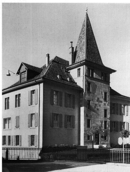
5: Maison Gaudard. Reconstituée vers 1670 par le lieutenant baillival en englobant plusieurs maisons du XIII e siècle. – Unter Einbezug von mehreren Häusern aus dem 13. Jh. um 1670 errichtet.

aval, le Grand hôpital, destiné à abriter les nécessiteux, a été reconstruit en 1766–1771 à l'emplacement d'anciens bâtiments de même fonction attestés dès le XIII e siècle; tout comme l'hôtel de ville, ce magnifique bâtiment témoigne de la puissance des bourgeois de la ville; il a été édifié par Rodolphe de Crousaz, un descendant d'Abraham, l'auteur des plans de l'hôtel de ville édifié un siècle plus tôt.