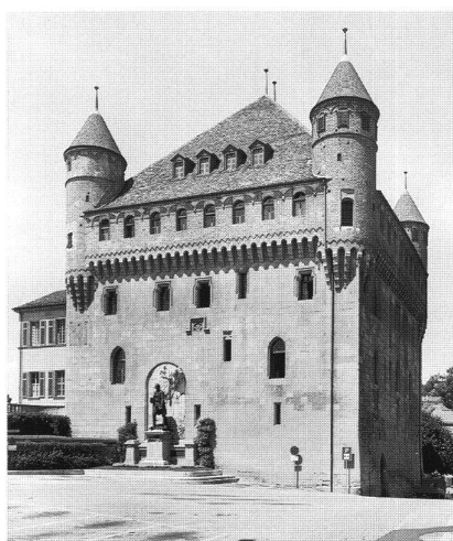
2: Château St-Maire. Construit entre 1397 et 1427 par l'évêque. Son couronnement en brique témoigne de l'intervention de maçons du nord de l'Italie au début du XV e siècle. – Zwischen 1397 und 1427 vom Bischof erbaut. Sein Maschikulkranz aus Backstein zeigt den Einfluss piemontesischer Baukunst seit dem Beginn des 15. Jhs.

sente la forme d'un gros cube de maçonnerie; l'étage supérieur concentre les défenses, avec un chemin de ronde crénelé sur mâchicoulis et des tourelles en encorbellement aux angles. L'usage de la brique, à ce niveau, tout comme à l'Evêché précité, témoigne de l'intervention de maçons du nord de l'Italie, dès le début du XV e siècle dans notre région 3 . Les défenses périphériques et l'imposante porte de Saint-Maire ont disparu au cours du XIX e siècle. Un troisième château, celui de Menthon, fermait le flanc oriental de la Cité; il s'agissait plutôt d'une maison forte mentionnée dès le XIV e ou le XV e avant de disparaître dans le courant du XVIII e siècle. Ses importants vestiges ont été brièvement remis au jour en 1979 4 , avant de céder place à un garage à voitures.