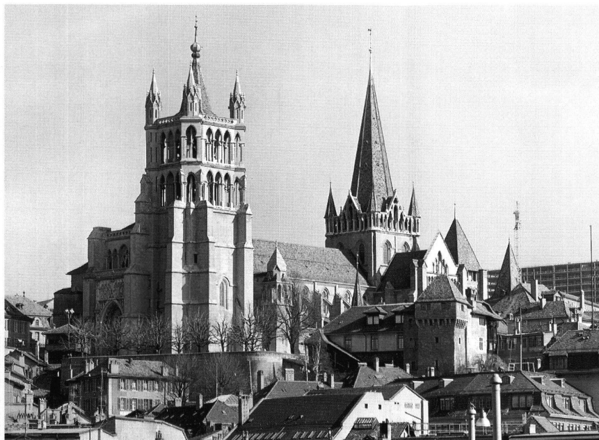
3: Cathédrale Notre-Dame. Edifiée dès 1150 et achevée vers 1232. Elle recouvre des constructions monumentales attestées dès l'époque romaine. – Erbaut seit 1150 und um 1232 vollendet. Sie überdeckt mehrere ältere Bauten, die bis in die Römerzeit zurückgehen.

l'université de Lausanne. Englobant plusieurs maisons de 1200–1300, la maison du lieutenant baillival Gaudard a été rebâtie vers 1670 (Fig. 5); un siècle plus tôt, face au portail des apôtres de la cathédrale, elle offrait au passant une incroyable décoration peinte d'allégories avec un singe se contemplant dans le miroir ou le pélican déchirant ses entrailles pour nourrir sa progéniture, dans un décor d'architecture feinte. En