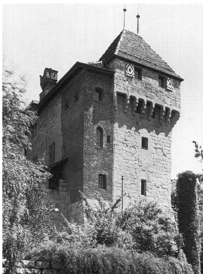
1: Ancien Evêché. Construit pour l'essentiel entre le XI e et le XV e siècle; il abrite le Musée historique de Lausanne. – Altes Bischöfliches Schloss, im Kern zwischen dem 11. und 15. Jh. entstanden; heute befindet sich darin das Historische Museum.

À l'origine, Lausanne n'occupe que le sommet de la colline, jusqu'à la cathédrale; elle s'étendra sur le flanc sud de la Cité entre le VII e et le IX e siècle. Un palais épiscopal défend ce côté de la Cité dès l'an mil, progressivement agrandi entre le XII e et le XV e siècle (Fig. 1); il abrite aujourd'hui le Musée historique de Lausanne, où une maquette avec son et lumière présente l'histoire de la ville. L'autre extrémité de la colline était défendue par le château Saint-Maire, construit entre 1397 et 1427 principalement sous l'évêque Guillaume de Challant (Fig. 2). Il pré-