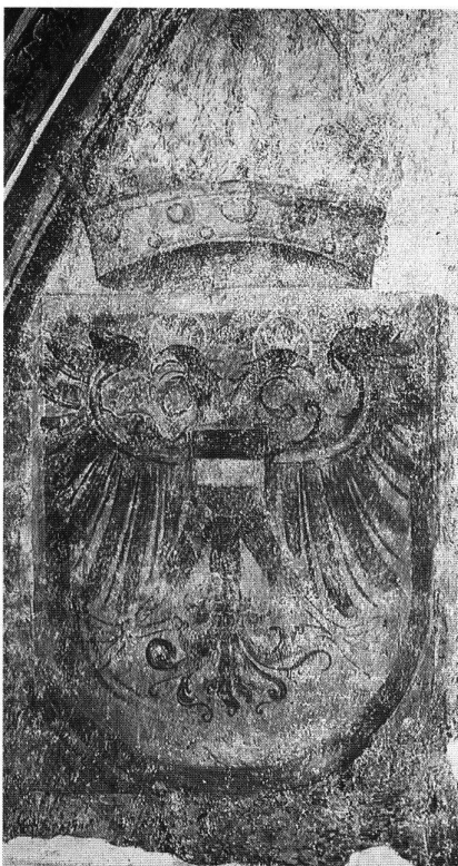
4: Doppeladlerwappen Kaiser Friedrichs III. mit Österreichischem Brustschild. Fresko um 1460 in der Pfarrkirche in Terlan/Südtirol.

Avec l'accord ou la confirmation de l'immédiateté impériale aux différentes entités de la Confédération, celles-ci utilisèrent l'aigle bicéphale impérial comme emblème jusqu'en 1648 – et parfois jusqu'en plein 18 e