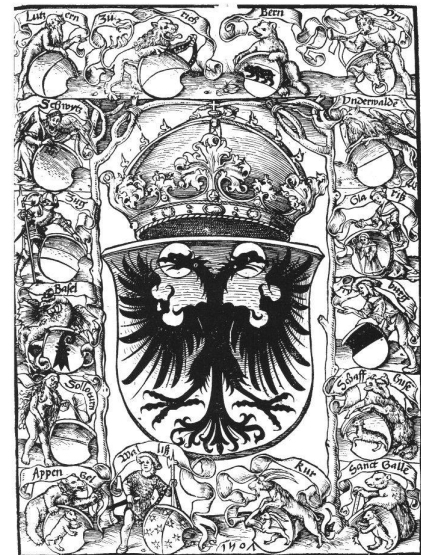
1: Titelblatt der ersten gedruckten Schweizer Chronik von 1507, verfasst von Petermann Etterlin.

der alten Schweizerischen Eidgenossenschaft bildet jenes Holzschnitt-Titelblatt der ersten gedruckten Schweizer Chronik aus dem Jahre 1507, verfasst von Petermann Etterlin, welches in der Mitte allein den nimbierten, schwarzen Doppeladler des Heiligen Römischen Reiches zeigt, um den oben sowie zu beiden Seiten die Wappenschilder der damaligen acht Bündnisorte Luzern, Zürich, Bern, Uri, Schwyz, Zug, Basel und Solothurn sowie Unterwalden, Glarus, Freiburg und Schaffhausen angeordnet erscheinen, ergänzt unten durch die Wappenschilder der vier damals bereits der Eidgenossenschaft zugewandten Orte Appenzell, Wallis, Chur und St. Gallen.