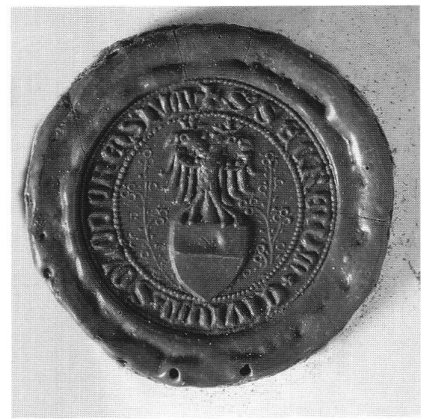
2: Kleines Sekretsiegel der Stadt Solothurn. Erstmals verwendet an einer Urkunde von 1394.

Bisher in der einschlägigen Literatur unbeachtet geblieben ist eine Freskodarstellung des einköpfigen, schwarzen Reichsadlers an der nordwestlichen Aussenfassade der Lenzburg im Aargau, wo dieser Adler ähnlich wie beim obgenannten Berner Stadtsiegel über dem Berner Bären angeordnet erscheint. Die Anbringung dieses Freskos erfolgte auch über Betreiben der Stadt Bern, die bekanntlich im Jahre 1415 den bis dahin habsburgischen Aargau in Besitz genommen hat, wobei die Tatsache, dass man sich hier noch des einköpfigen Adlers bedient hat, darauf hinzuweisen scheint, dass die Anbringung