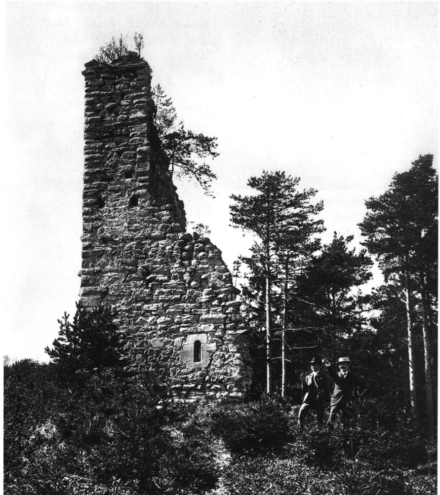
1: Burgruine Grimmenstein (St. Margrethen SG) um 1900.

Um 1900 begann man sich dann aber mit den zahlreichen Schlössern und Burgruinen zu befassen, wobei deren Sicherung und Restaurierung dringlichstes Anliegen war. 1899