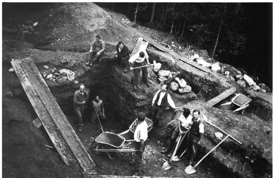
3: Ausgrabungsarbeiten auf Grimmenstein 1936.

Die Zeit der Arbeitslosenlager endete mit dem Beginn des Zweiten Weltkrieges, da die Kräfte abgezogen und anderweitig eingesetzt wurden. G. Felder hielt abschliessend die wichtigsten Ergebnisse