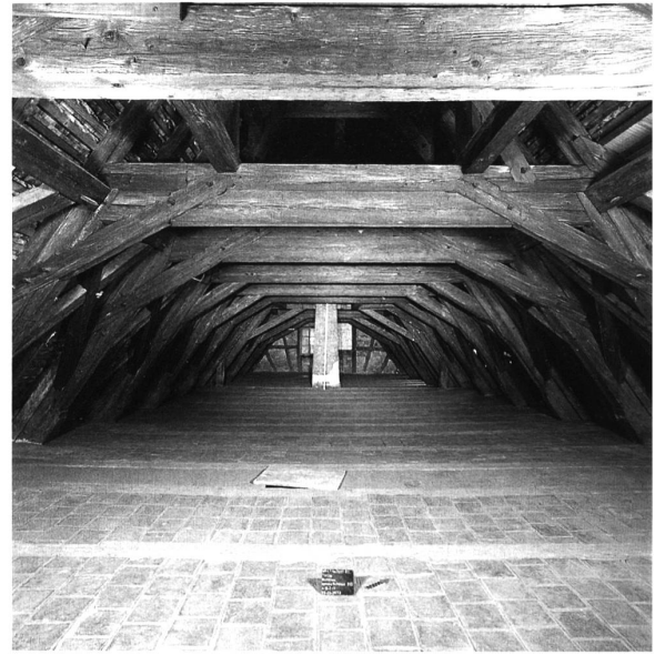
5: Thun, Schloss. Mittlerer Abschnitt des südlichen Schlosstrakts, liegender Dachstuhl des Kernbaus von 1566/67. Blick nach Nordwesten.

auch besiedelt war. Um 1200, während der Herrschaft von Berthold V. von Zähringen (um 1160–1218), wurde der imposante Donjon mit dem Festsaal im Obergeschoss errichtet. Der verwendete Kalkmörtel mit beigemengtem Ziegelschrot legt nahe, dass Turm und anschliessende Ringmauern etwa zeitgleich entstanden sind.