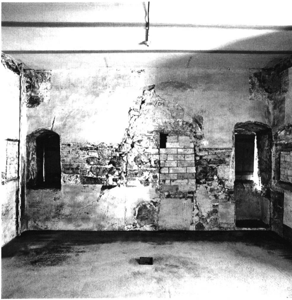
4: Thun, Schloss. Wohngeschoss im Torturm mit Kamin und Fenstern. Blick nach Südosten.