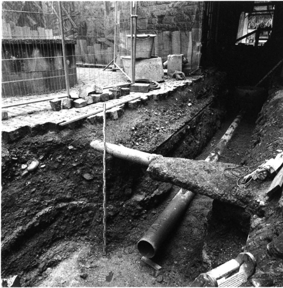
2: Thun, Schloss. Leitungsraben im Hof mit der ältesten Abbruchschicht im unteren Profilabschnitt. Blick nach Nordosten.

Die ehemaligen Schlossbauten und der neuzeitliche Gefängnisstrakt werden seit Anfang 2013 behutsam saniert und für die künftige Nutzung als Hotel und Schulungszentrum umgebaut. Kantonale Denkmalpflege und Ar-