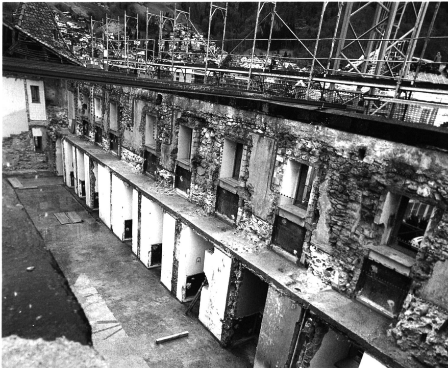
3: Thun, Schloss. Östliche Ringmauer im ehemaligen Gefängnisbau. Zeichnerisch rekonstruiert sind Zinnen und Wehrgang. Blick nach Nordosten.

Eine ältere hochmittelalterliche Abbruchschicht im westlichen Hofareal belegt, dass schon vor dem Bau des Donjons Steinbauten auf dem Burgareal bestanden haben (Abb. 2). Bereits Paul Hofer hatte vier Mauerzüge beobachtet, die er – wie sich nun wohl richtigerweise zeigt – teils vom südlichen Turmfundament überlagert sah. Zu postulieren ist eine ältere Burg, die im Laufe des 12. Jh. vielleicht von den Zähringern gegründet wurde. Einige Keramikscherben belegen, dass der Schlossberg schon lange zuvor, in vor- und frühgeschichtlicher sowie in spätrömischer Zeit, begangen wurde und vermutlich