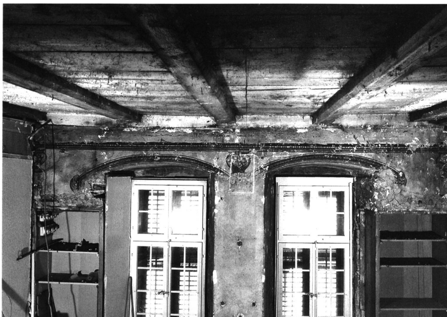
6: Thun, Schloss. Mittlerer Abschnitt des südlichen Schlosstrakts, kleiner Saal im ersten Obergeschoss des Kernbaus. Die Decke dürfte etwa zeitlich parallel zum Dachstuhl um 1566/67 entstanden sein. Die spätbarocke Grisaille-Malerei von 1700 an der Südwand deutet die ehemalige Fenstergliederung an. Blick nach Südwesten.

bild vielleicht suggerieren mag. Entstanden ist er vielmehr wahrscheinlich aus einem kleineren Kernbau im mittleren Abschnitt. Älteres Mauerwerk unter dem Erdgeschossboden könnte auf einen mittelalterlichen Steinbau hinweisen. Dieser mag als Palas oder Wohnbau zu deuten sein.