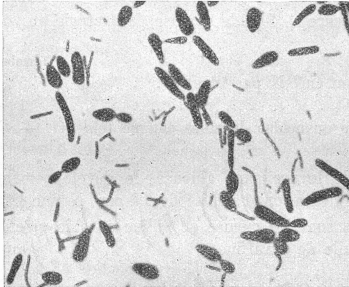
Fig. 2. Levures et bactéries. Gross. 900 fois.

Un granule écrasé, examiné au microscope, présente un amas de cellules de levures, auxquelles sont mêlées des bactéries, le tout étant enrobé par une matière amorphe, qui se colore en rose par la fuchsine après fixation par la chaleur (fig. 2). Les levures très abondantes, constituent la