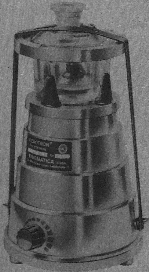
Typ MB 0.3