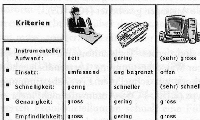
Abbildung 3 Allegorie – Entwicklung von Rechenmethoden ↔ Schnellmethoden

Akzeptiert man diesen Vergleich, so sollte das für die zukünftigen Möglichkeiten auf dem Sektor der Schnellmethoden bedeuten, dass durch die zu erwartenden High-Tech-Fortschritte auf vielen analytischen Gebieten die Entwicklung noch mehr als schon bisher in Richtung des Organisationstyps tendieren dürfte.