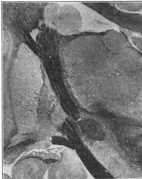
Fig. II. Frontalschnitt durch ein menschliches Gehirn. Man sieht hier an grauen Kernen: längs des linken Randes der Abbildung gewahrt man das Claustrum und nach innen von ihm das Putamen, welches seinerseits dem Globus pallidus von aussen anliegt; unten links erkennt man das Ammonshorn mit dem Alveus und mit der Fimbria fornicis; den ganzen mittleren Teil des rechten Randes nimmt der Thalamus opticus ein, und unter ihm sieht man linkerseits das Corpus Luysii und rechterseits den Nucleus ruber Stillingi; oberhalb des Thalamus befindet sich im Seitenventrikel der Nucleus caudatus.

Wir konstatieren hier einen scheinbaren totalen Durchbruch der Capsula interna durch einen recht breiten Zug grauer Substanz, welche den Globus pallidus direkt mit dem Locus niger verbindet (s. Fig. II).