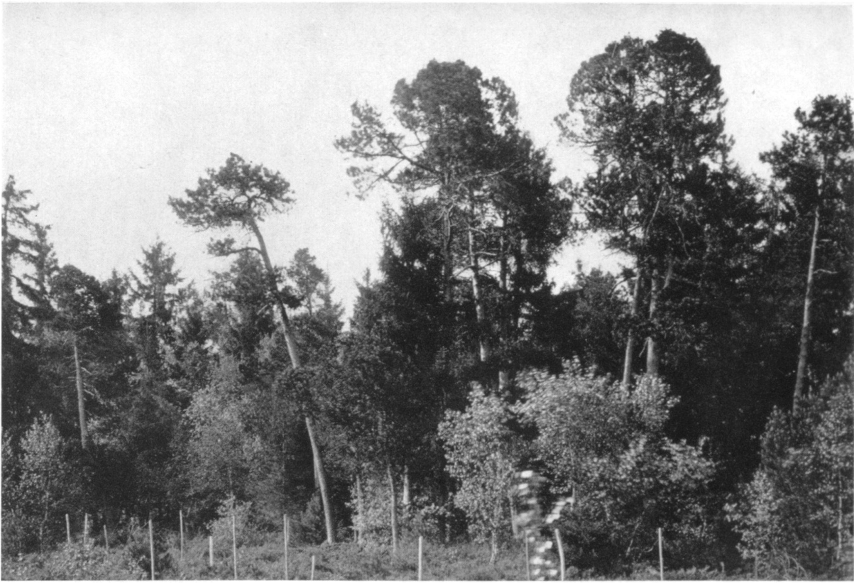
IV Torfhölzli in Niedermuhlern, Hochmoorwald, bestockt mit Föhren, Pinus Mugo var. uncinata Willkomm., Fichten, Picea excelsa Link, Birken. Betula pendula Roth, vorwiegend in Jungbeständen und durchsetzt mit Faulbaum, Frangula Alnus Miller. Dem Austrocknungsprozeß entsprechend herrschen im Pflanzenbestand die Ericaceen vor. Siehe Seite 88.