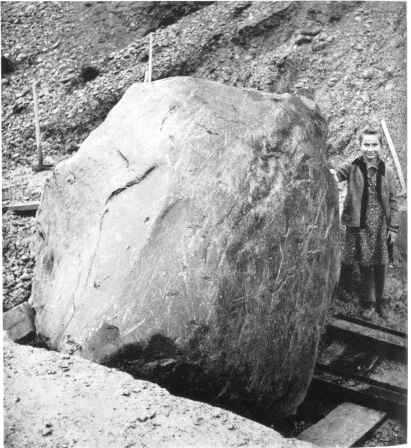
II Kieselkalkblock , Findling aus dem Lias der Freiburgeralpen, in der Kiesgrube Oberwangen nach der Sprengung vom 16. September 1949. Deutliche Gletscherschrammen. Siehe Seite 93.