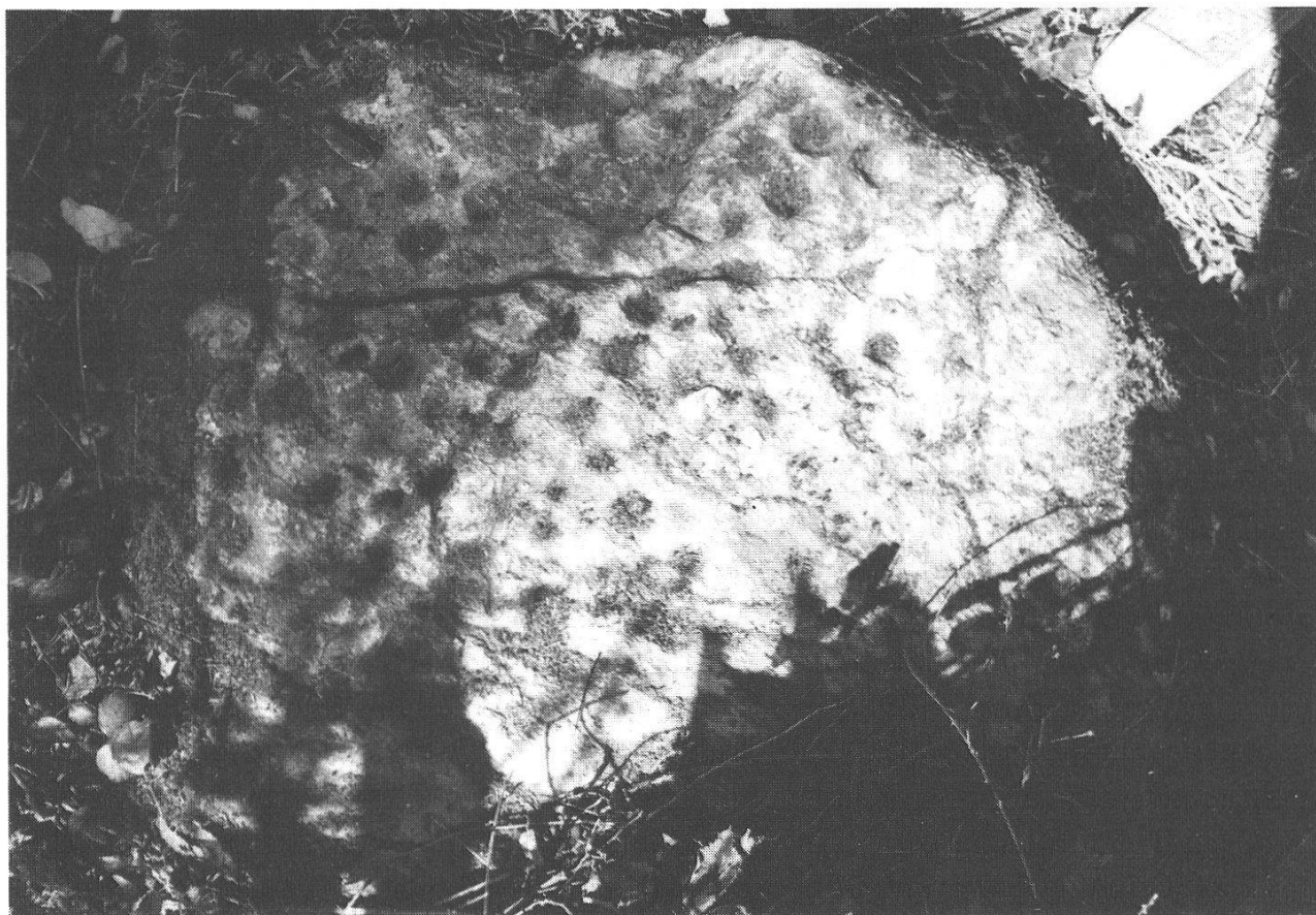
Abb. 14: (37) Chlorit-Muskowit-Gneis am Chräyenberg, vermutlich aus dem Dent Blanche-Massiv mit etwa 30 künstlichen Schalen (Detail des Schalenmusters).