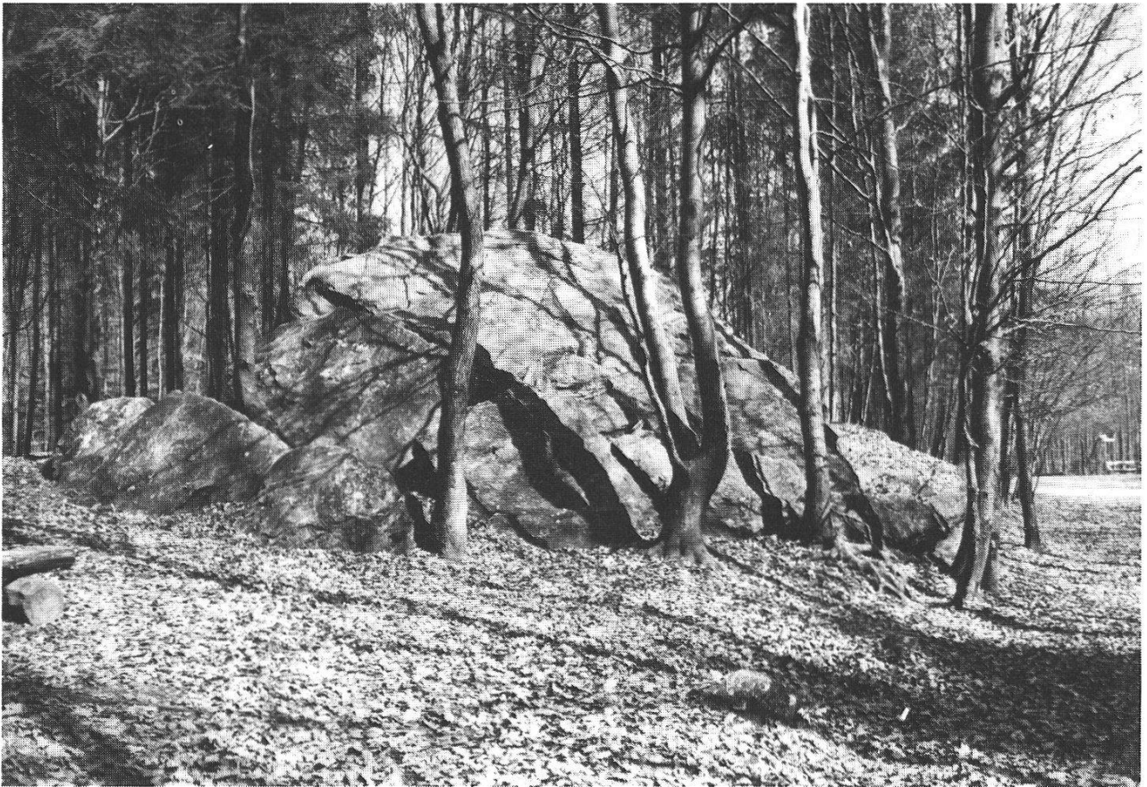
Abb. 12: (7) Der „Heidenstein“ im Längholz. Dieser grösste Block des Waldes besteht aus einem schieferigen Kalk-Glimmer-Gneis und stammt aus einer Gneis-Zone der südlichen Walliser Seitentäler.