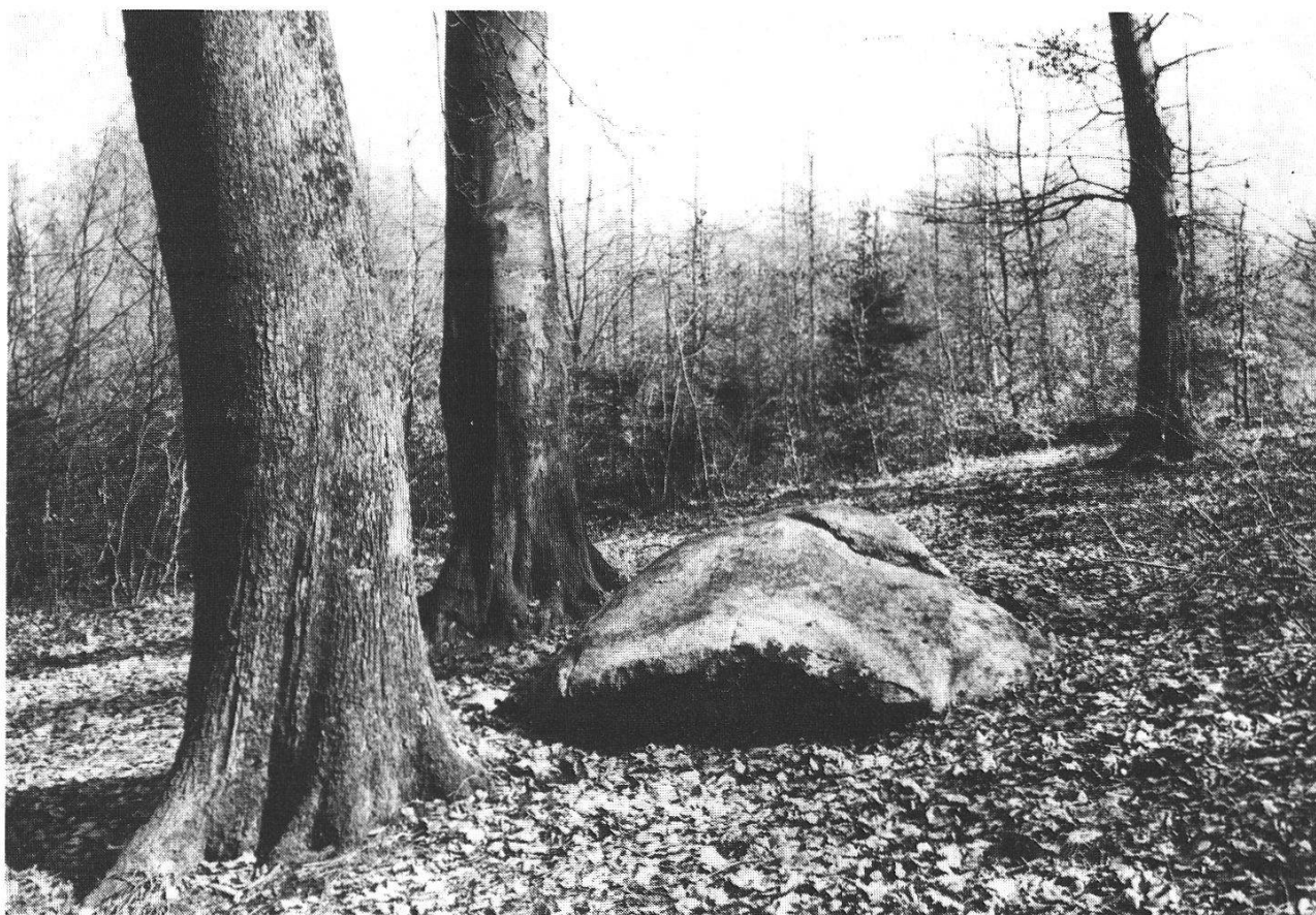
Abb. 15: (23) Chlorit-Sericit-Gneis im Bärletwald aus dem Dent Blanche-Massiv. Der Block besitzt eine Gleitrinne zum Abrutschen und mehrere Bohrlöcher.