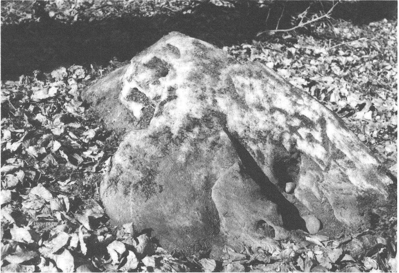
Abb. 13: (40) Marmor-Block im Ischlag aus einem der südlichen Walliser Seitentäler mit natürlichen, gletschermühleartigen Vertiefungen.