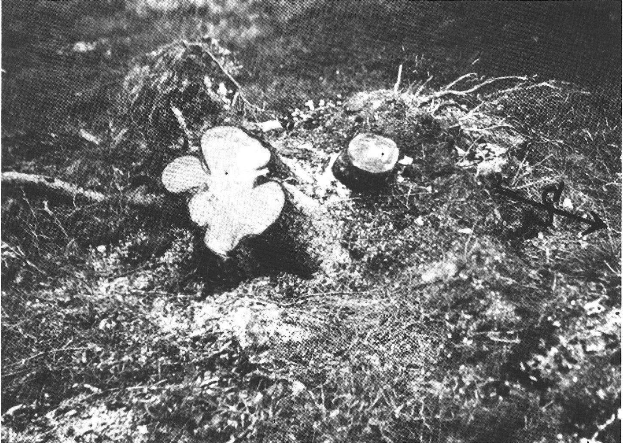
Abb. Strunk des Fichtenstammes ( Picea ): links Strunk des Vogelbeerbaumes ( Sorbus ): rechts (Der Pfeil zeigt nach Süden, im Bild nach rechts. Als Beschauer blicken wir gegen Osten)

einem Durchmesser von 35 bis 46 cm, war, gemessen vom Mark bis zur Rinde, in Richtung SW 26 cm dick, in Richtung NE nur 20 cm. Ein Auswuchs in N-Richtung dürfte einem früh abgezweigten Seitenspross gehört haben. Der Ebereschenstamm, Durchmesser 16 bis 18 cm, mass vom Mark bis zur Rinde auf der SW-Seite bloss 5 cm, auf der NE-Seite dagegen 12 cm. In beiden erwähnten Himmelsrichtungen war der Zutritt des Sonnenlichts durch keine andern Bäume versperrt. Das starke Dickenwachstum der Fichte auf der S/SW-Seite ist verständlich als Wirkung der Mittags- und Nachmittagsbesonnung. Dass die NE-Seite auch etwas mächtiger wurde unter dem Einfluss der Morgensonne könnte, wie die Verdickungen auf der Gegenseite, mit einer "lokalen Steuerung" Gymnospermen gegenüber Angiospermen erklärt werden. Nicht so bei der Eberesche: Sie hat ihr grösstes Dickenwachstum an der Morgensonne, bildet keine Auswüchse am Stamm, was auf eine "zentrale Steuerung" schliessen lässt. Weshalb aber ist die Morgensonne die wirksamste? Der Laubbaum ist sensibler als der eher träge Nadelbaum. Es gilt hier wohl auch der bei den Kräutern bekannte Anspruch auf eine bestimmte Lichtmenge pro Tag. Wenn sie erreicht ist bis gegen Mittag bei