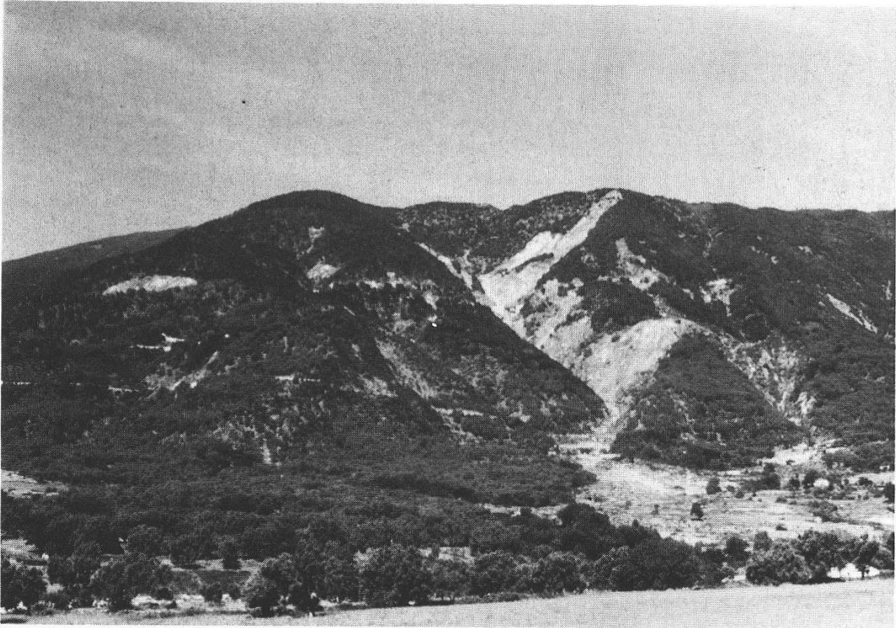
Abb. 1: Die Vegetationsstufung an einem SE-Hang oberhalb Plati: unten Olivenhaine (hellgrau), darüber Quercus ilex -Bestände und etwas Erica arborea (dunkel) und zuoberst sommergrüner Eichenmischwald.