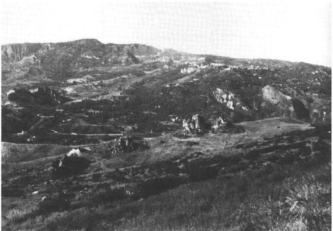
Abb. 2: Blick nach NE auf herausgewitterte Vulkanfelsen (im Vordergrund) und die Kalkkette mit dem Mt. Canolo im Hintergrund.

Trotz der Sommertrockenheit ist in Kalabrien eine Moorbildung in höheren Lagen möglich. Auf der Hochebene liegen zwei Quellmoorkomplexe zwischen 950 und 1000 m. Das Moor von Mastrogiovanni ist inzwischen leider in eine Wasserfassung umgewandelt worden, so dass man nur noch spärliche Überreste der einstigen Moor-