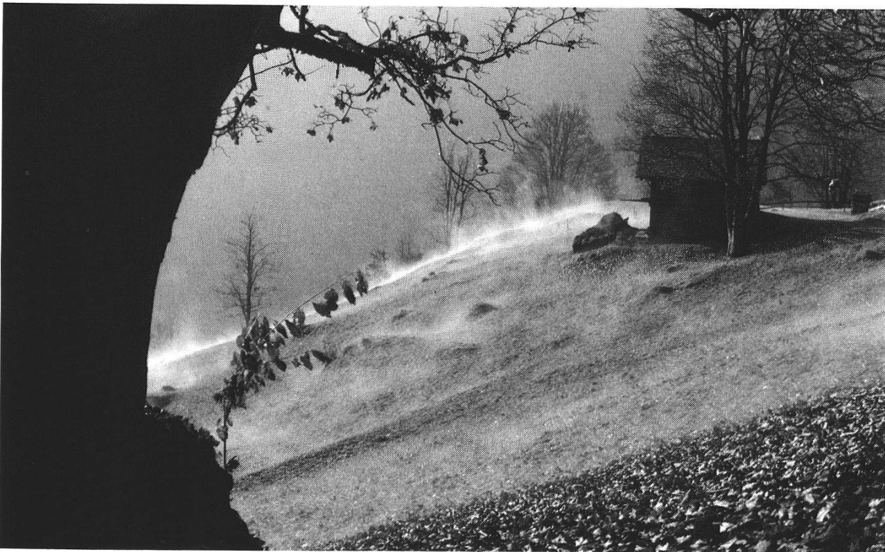
Abbildung 2 Die Berglandwirtschaft hat sich der Natur in einem langen Prozess angepasst. Wenn sie verschwindet, ist auch die Natur gefährdet.

Die Landwirtschaft ist also zu einem entscheidenden Bestandteil der Landschaft und des Naturhaushalts geworden. Wenn sie wegfällt oder wenn sie unangepasste Bewirtschaftungsmethoden übernimmt, entstehen Schäden, die diejenigen des Fremdenverkehrs bei weitem übersteigen, weil die gesamte Fläche betroffen würde.