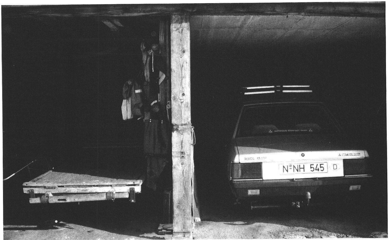
Abbildung 3 Die Zukunft der Berggebiete ist vom Gleichgewicht zwischen Fremdenverkehr und Berglandwirtschaft abhängig. Der Fremdenverkehr darf sich nicht verselbständigen.

Solche und ähnliche Prozesse im wirtschaftlichen und gesellschaftlichen Bereich können das eingespielte Gleichgewicht zwischen Landwirtschaft und Fremdenverkehr stören und zu einem Zusammenbruch der Landwirtschaft als dem wirtschaftlich schwächeren Partner führen, womit sich ganz unvermittelt grosse Zerstörungen im Naturhaushalt und im Landschaftsbild einstellen würden, was auch Auswirkungen auf die touristische Nachfrage hätte.