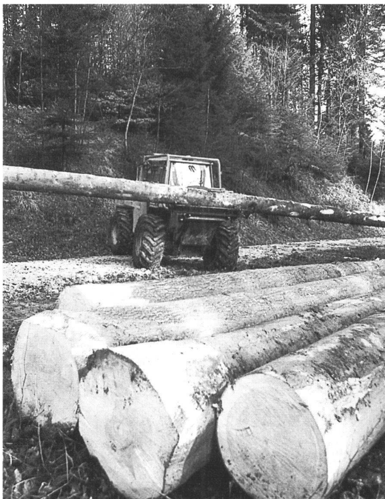
Abbildung 25: Holzproduktion; Holz als zukunftsfähiger Rohstoff.

Weitere Schwerpunkte der forstlichen Tätigkeiten im Gürbetal bilden die Förderung der Energieholznachfrage und die Bereitstellung eines angemessenen Energieholzangebotes, die Förderung der Vielfalt im Lebensraum Wald, die Schaffung geeigneter organisatorischer Strukturen für die Waldpflege und die Sicherung des Waldes als Erholungsraum.