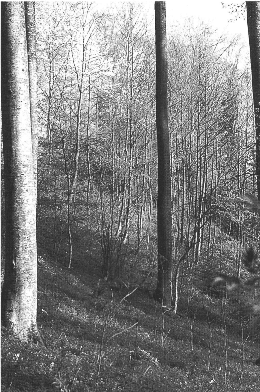
Abbildung 23: Waldverjüngung. (Foto Ph. Mösch, März 1997)