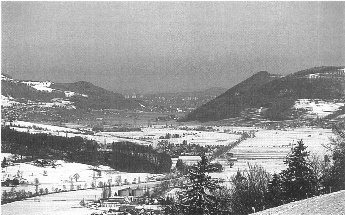
Abbildung 24: Blick ins Gürbetal mit den bewaldeten Hängen. (Foto H. Jost, März 1995)