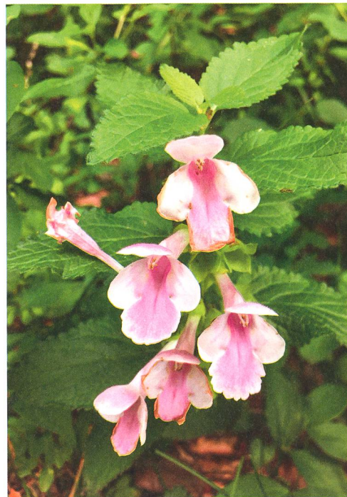
Das rosa bis weisslich blühende Immenblatt ( Melittis melissophyllum ) hat seine Hauptverbreitung in den Wäldern des Juras.

en-Storchschnabel ( G. pyrenaicum ) und Stinkender Storchschnabel ( G. robertianum ).