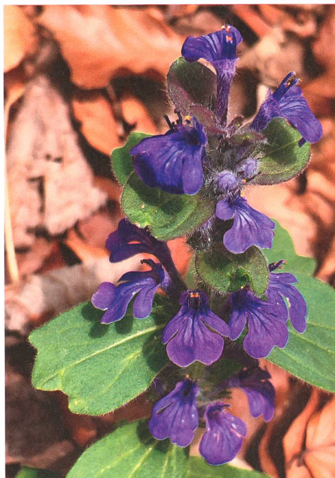
Die leicht zottig behaarten Blätter des Genfer Günsels ( Ajuga genevensis ) sind im Blütenstand deutlich gezähnt bis dreiteilig.