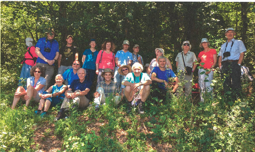
99 Jahre später: An der BBG-Exkursion vom 2. Juni 2018 in die Felsenheide von Pieterlen nahmen 10 Frauen und 10 Männer teil.