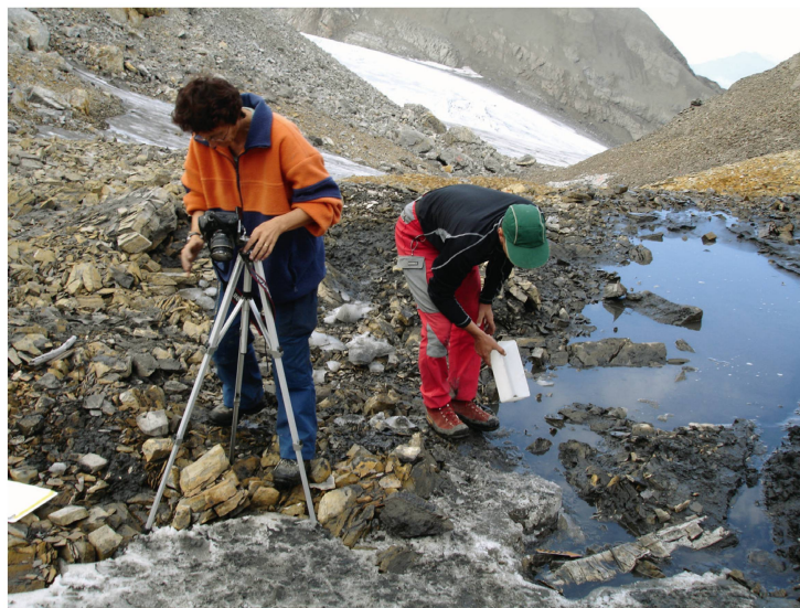
Abb. 4: «Eisarchäologie» – Fundsituation im Gelände. Am Rande eines auftauenden Eisfelds wurde im Jahre 2005 ein neolithisches Bogenfutteral (rechts unten) gefunden. Die Fundstelle wird hier dokumentiert.

Funde stammen aus dem Neolithikum, so ein Bogenfutteral aus Birkenrinde, ein Pfeilbogen und mehrere vollständige Pfeile. In der Presse wurde das Bogenfutteral und einige Pfeile als Jagdausrüstung einem Menschen namens «Schnidi» (Name analog zum «Ötzi») zugeordnet. Da es sich um Einzel-