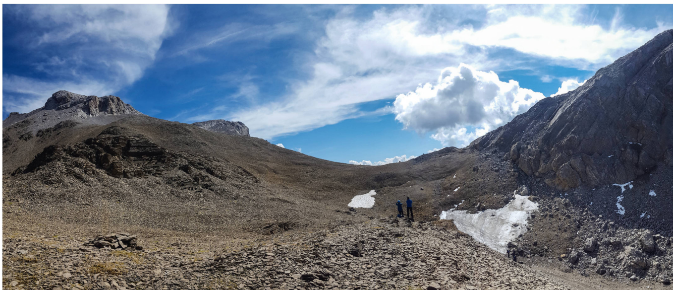
Abb. 3: Situation im Wildhorngebiet und am Schnidejoch (Passübergang links der Bildmitte). Die NE Flanke des Wildhorns (3250 m; rechts der Bildmitte) ist immer noch vergletschert. Archäologische Gegenstände wurden am Rande der zwei grösseren Eisflecken unterhalb der Schnidejochs gefunden (auffallend ist vor allem der grössere, dreieckige Eisfleck links unterhalb der Bildmitte).

Eine weitere interessante Anwendung ist die Quellenzuordnung von Feinstaub und \text{CO}_2 . Fossile Brennstoffe enthalten kein messbares ^{14}\text{C} , erneuerbare Brennstoffe (z. B. Holz für Holzheizungen) liefern Verbrennungsprodukte mit höheren, modernen ^{14}\text{C} -Werten. Interessant ist auch der Vergleich von Messstationen. So sind die fossilen Beiträge auf dem Schauinsland (Schwarzwald) etwas höher als jene auf dem Jungfrauojoch. Auch Methanquellen lassen sich so unterscheiden: Methan als rezentes Sumpfgas hat deutlich höhere ^{14}\text{C} -Gehalte als das (fossile) Erdgas aus geologischen Formationen.