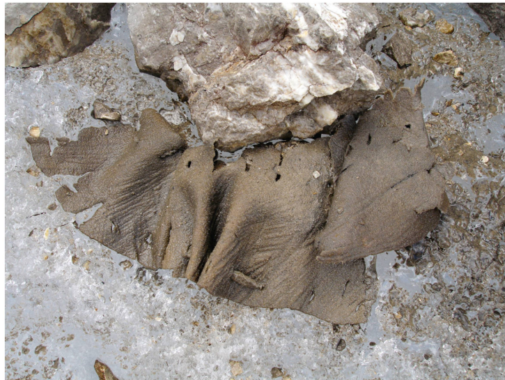
Abb. 6: Fundsituation des frühbronzezeitlichen Lederschuhs am Eisrand. Es handelt sich um Leder mit Haarresten.

SZIDAT S. und STAPPER R.: Radiokohlenstoffdatierungen heute. Mitteilungen der Naturforschenden Gesellschaft Bern 2018, 20–39.