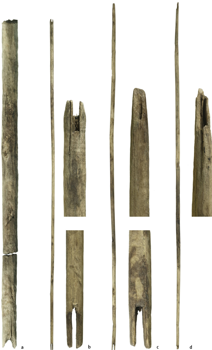
Abb. 5: Fragmente von Holzpfeilen aus dem Neolithikum (Jungsteinzeit). Das Objekt a (links) ist erstaunlich alt und stammt aus der Mitte des 5. Jahrtausends v. Chr. Die Objekte b bis d (Mitte bis rechts) werden als Teil der Ausrüstung des hypothetischen «Schnidi» angesehen und stammen aus dem Endneolithikum, also aus dem 3. Jahrtausend v. Chr.

funde handelt und die Schichtabfolge somit nicht bekannt ist, konnten nur Radiokarbon-Datierungen mehr Klarheit über das Alter und die Zusammengehörigkeit der Funde schaffen.