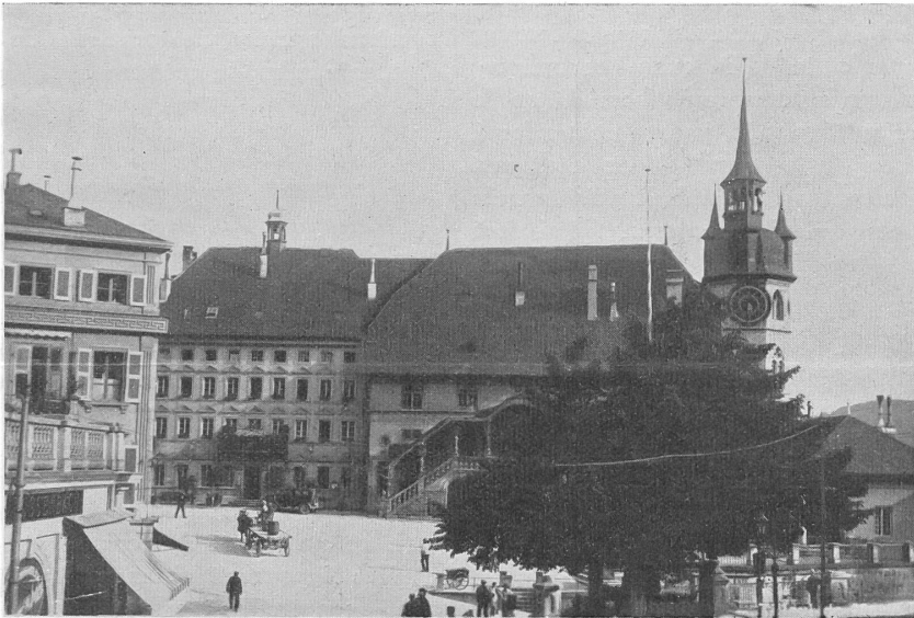
Fribourg. Le tilleul de Morat et l'Hôtel de Ville