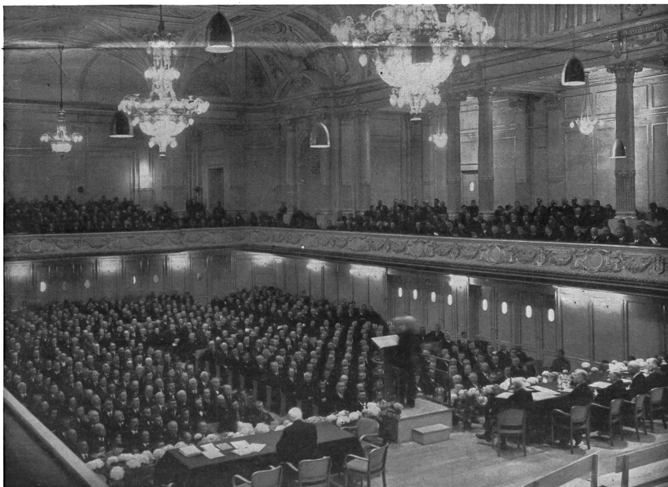
L'assemblée plénière dans la somptueuse salle de fête du Palais des congrès.

Dans le cadre de l'Exposition nationale — magnifique synthèse du travail et de l'esprit suisses — et dans une atmosphère de concorde et de ferveur patriotique, 1800 raiffeisenistes accourus de la Suisse entière, délibèrent des affaires de l'Union et proclament leur fidélité indéfectible à l'idéal de Raiffeisen.