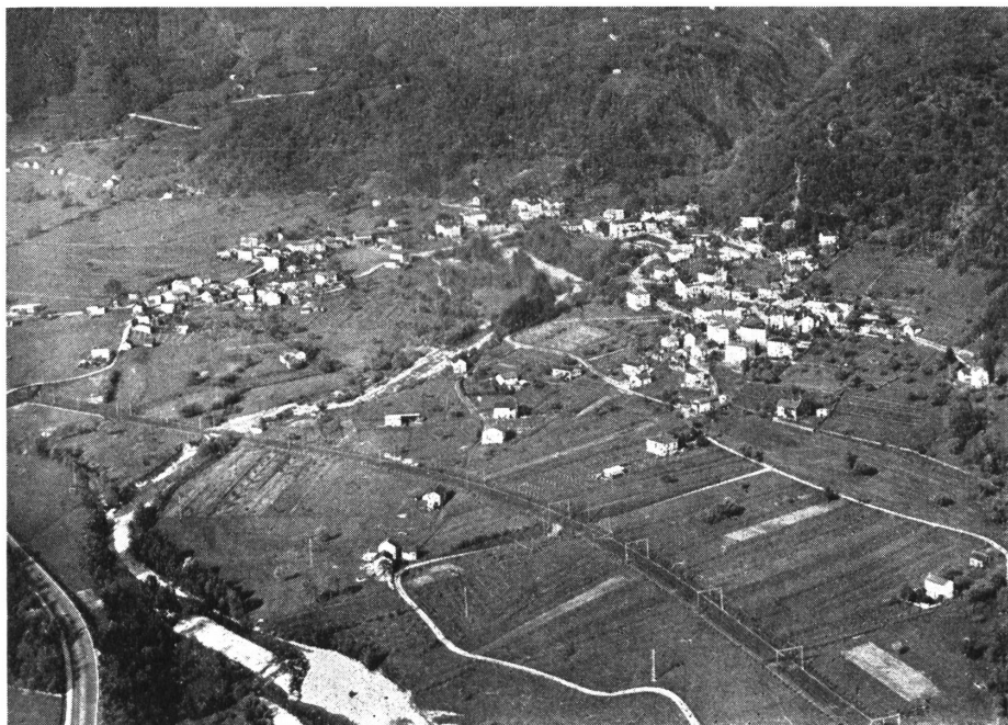
Veduta di Camignolo dov'è stata fondata la 74.ma Cassa Raiffeisen del Ticino (vedi relazione nel No. 6)

Al termine del rapporto del revisore del-