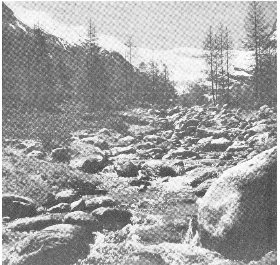
La Borgne à Ferpècle (Val d'Hérens)