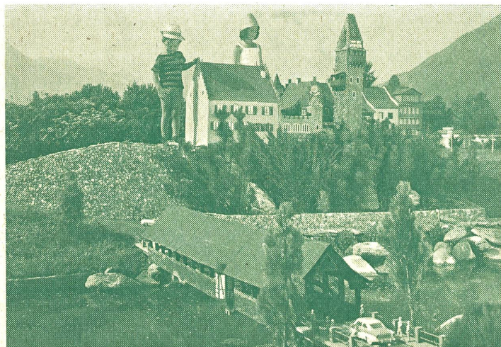
Suisse miniature, Melide