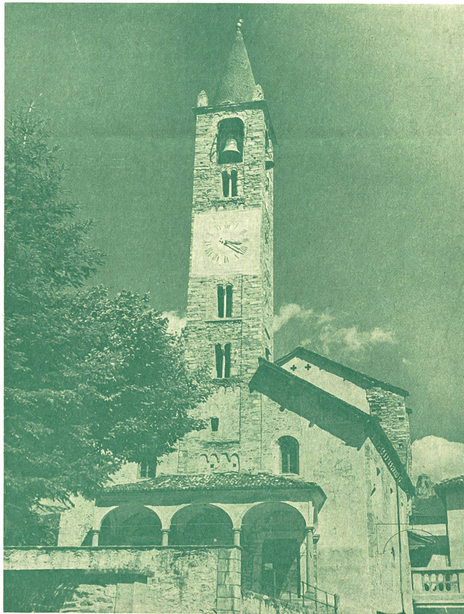
L'église de Tesserete, près de Lugano

Et voici quelques commentaires sur le compte d'exploitation de nos Caisses de crédit mutuel pour l'exercice 1966. Il est malheureusement moins réjouissant que celui de 1965 ; l'excédent net notamment n'a pu suivre complètement le rythme de l'évolution