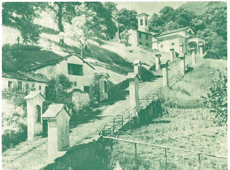
Via Crucis, Bidogno