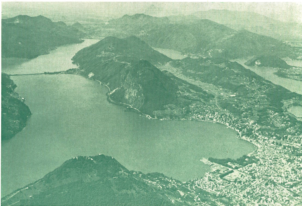
LUGANO, son lac et le Monte San Salvatore