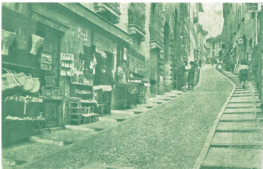
La montée vers la cathédrale

dans la diffusion des anciens maîtres d'Italie. Ici, Milan tient lieu de Paris pour la Suisse romande, avec cette différence que Milan est à la porte, une ville aussi importante, aussi vivante que Rome. Il y a là de quoi arracher à la torpeur provinciale ceux qui risqueraient d'y sombrer. Alors que la campagne tessinoise plus vraiment campagne qu'ailleurs en Suisse — malgré le réseau de routes remarquable dont elle dispose aujourd'hui — les villes, comme nous l'avons dit, se sentent dans le rayonnement d'une grande cité. Il ne faudrait pas croire qu'à Lugano ou Bellinzone l'influence de cette grande cité et du grand pays voisin ait pour effet d'affaiblir dans le Tessin le sentiment d'appartenance à la Suisse. L' italianità de la Suisse italienne se marie parfaitement avec l'esprit helvétique.