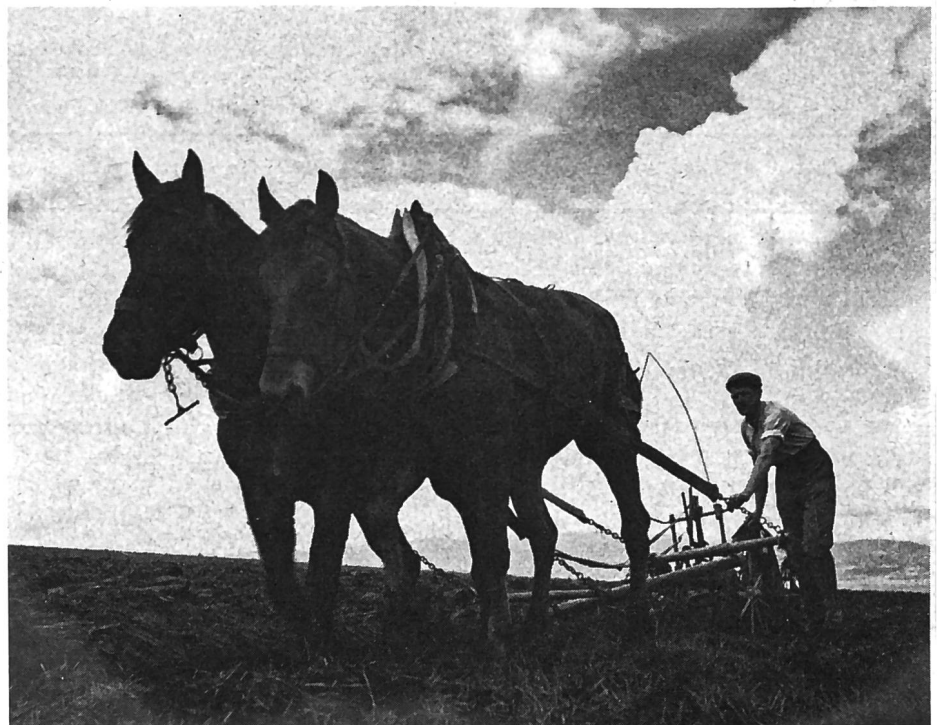
Labours printaniers d'autrefois

Sur le marché du bois , les prix des grumes ont atteint un point culminant ce printemps et par la suite ils ont peu à peu baissé du fait que la demande a diminué à la suite de la réduction des activités dans le secteur du bâtiment et de la détente conjoncturelle. La demande de bois à papier est restée vive ce qui a provoqué une majoration de prix pour ce genre de bois cet automne tandis que dans les autres catégories de grumes, les producteurs se sont contentés de maintenir plus ou moins les anciens prix.