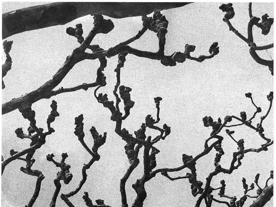
Platanes au premier temps avant la taille.