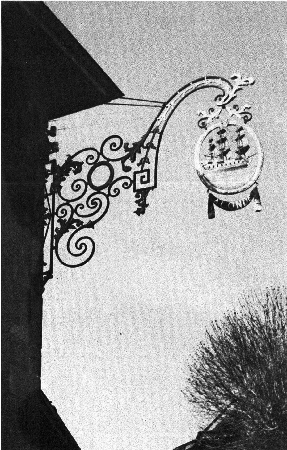
Une enseigne que l'on n'a pas sortie d'un musée, celle de l'Auberge de l'Onde à Saint-Saphorin a toujours été là.

(Tiré du cahier No 98 « Informations et documents » de la Fédération Centrale du Crédit Agricole Mutuel, à Paris).