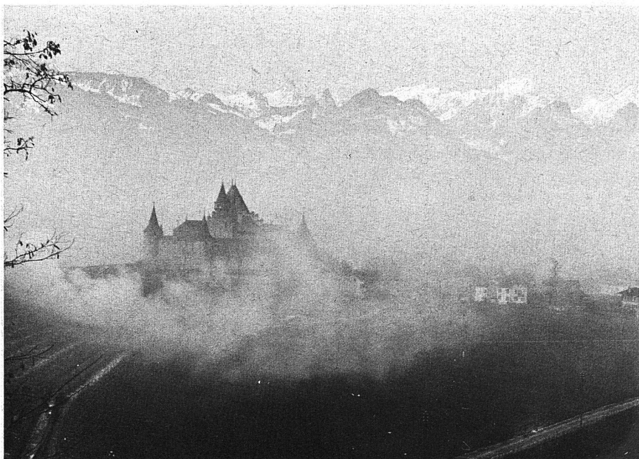
Effet de brouillard matinal près du Château d'Aigle.