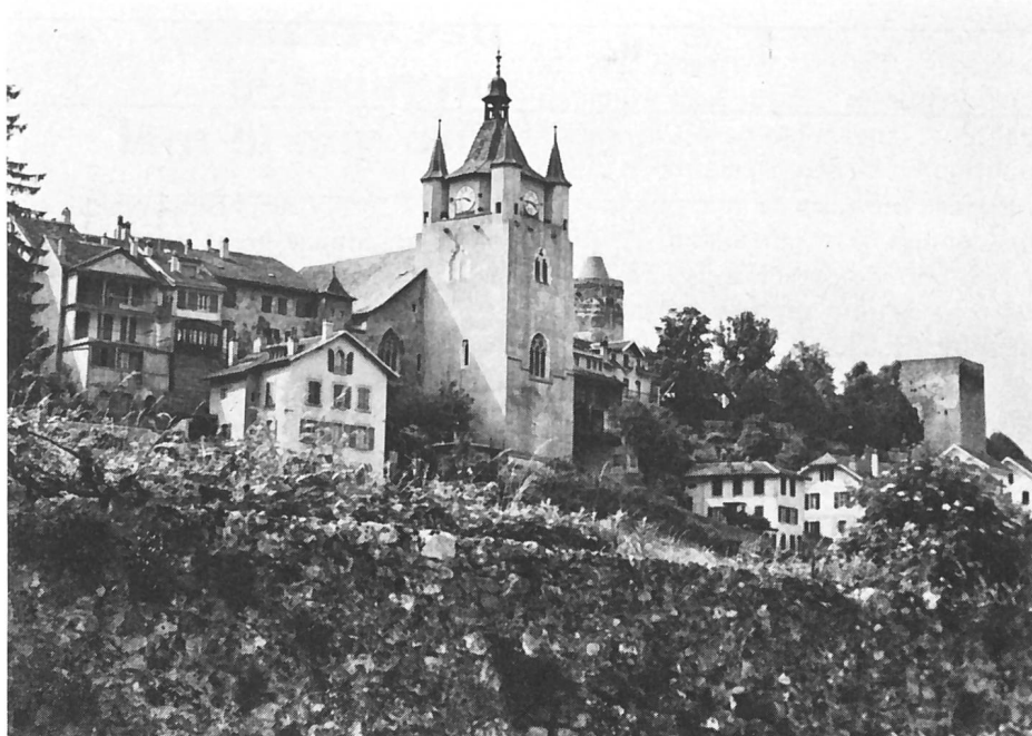
Le Château d'Orbe où séjourna souvent le roi Rodolphe 1er de Bourgogne