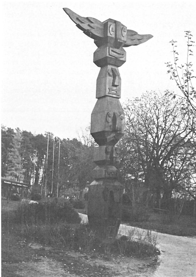
De bois, de fer ou de pierre, ornement de nos parcs et promenades «l'esprit de la tribu» nous rappelle notre besoin ancestral de mysticisme...

ne risque-t-il pas de semer quelques doutes dans le public au sujet des qualités ou des capacités de nos gérants? Cela n'est certainement pas le cas. Les demandes traitées sous cette rubrique ont toutes été puisées dans les correspondances que nous échangeons. Les questions posées le sont en bonne partie par d'anciens gérants, désireux de voir leur point de vue confirmé ou un doute dissipé. Le désir d'apprendre, de compléter ou de perfectionner ses connaissances n'est pas un signe de faiblesse, bien au contraire: c'est la marque du fonctionnaire qui tient à fournir en tout temps un travail impeccable. — pp —