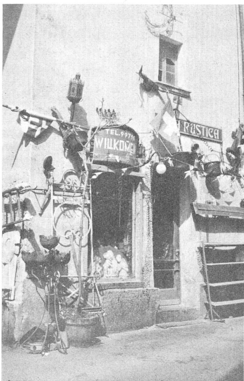
Perlomeno curiosa questa « Casa rustica » in un villaggio ticinese, la cui finestrella dal vetro rotto sembra ammiccare ai turisti.

inoltre ad innumerevoli assemblee di Casse Rurali. Egli è noto soprattutto anche quale redattore della pubblicazione dell'Unione Le Messenger Raiffeisen .