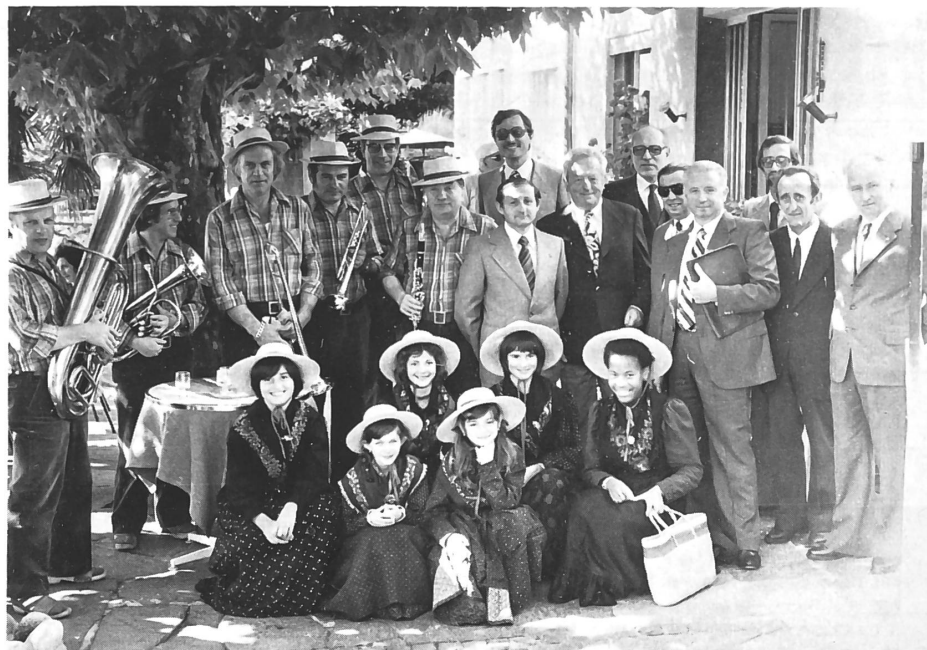
La Cassa Raiffeisen di Loco — il cui raggio di attività comprende anche i comuni di Auresio, Berzona, Mosogno e Russo — ha festeggiato il ventennio con 3,6 milioni di fr. di bilancio e 120 soci. Nella fotografia, un gruppetto di bambine in costume onsernonese, la Bandella Remigia, gerente ed alcuni dirigenti della Cassa con rappresentanti dell'Unione e della Federazione.

Sono 28, con un bilancio di 2,07 miliardi. I banchieri privati costituiscono la più vecchia forma di impresa bancaria svizzera. Essi rispondono col loro patrimonio personale, in modo illimitato, degli impegni contratti dal proprio istituto. Uno solo di essi si rivolge al pubblico per ottenere dei depositi. I banchieri privati si occupano soprattutto delle operazioni su titoli e dell'amministrazione di patrimoni. Il volume dei titoli amministrati per i loro clienti, come pure quello delle loro operazioni in borsa, gli permettono di collaborare alle emissioni di titoli, partecipando a sindacati svizzeri e internazionali.