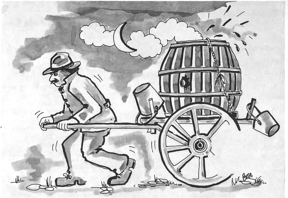
«Al tira fò 'l carét e via...».

Al branca'l sédèl, al sa sgòba sù la surgent... «Pim, pum... pam!» gà riva sül cò, sù la schéna, sù i gamb, sül carét e sül vasèl, tant da qui sass,