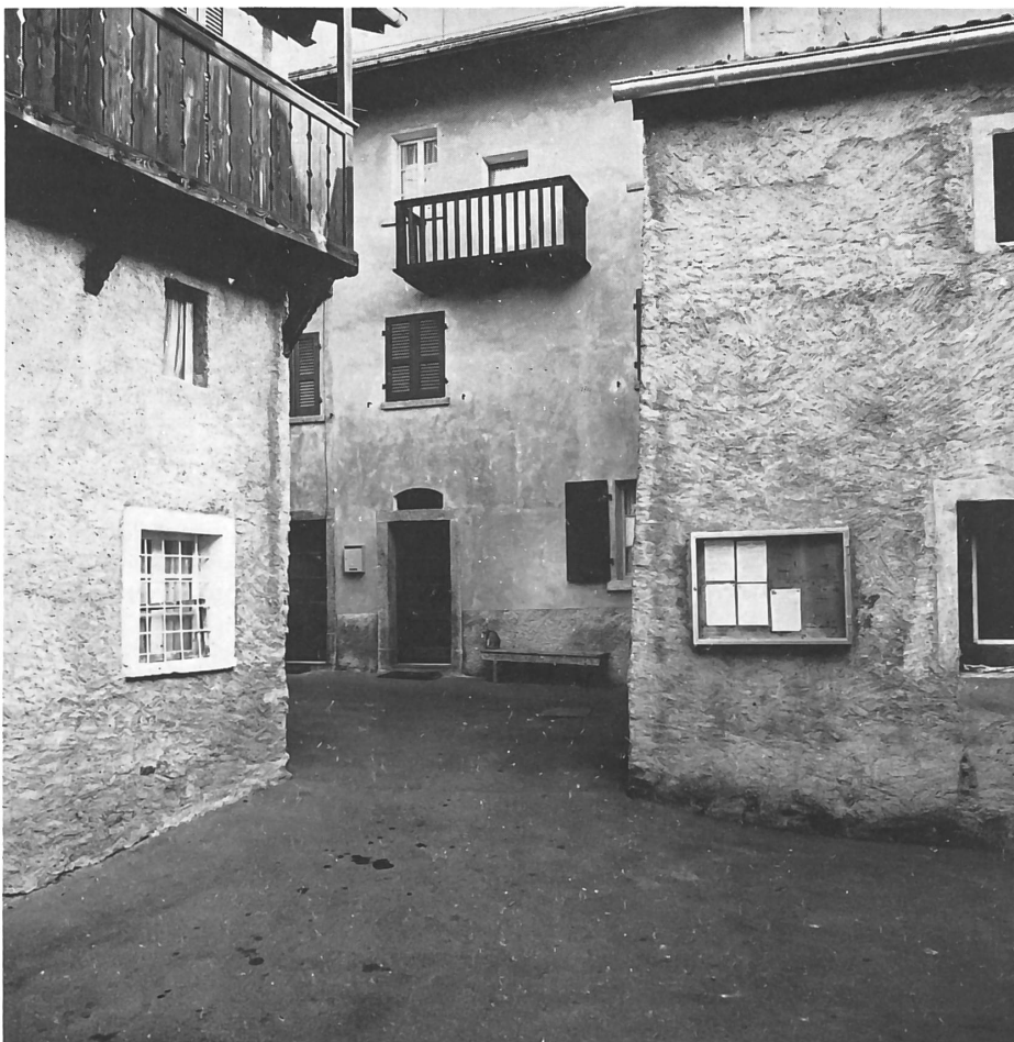
La caratteristica piazzetta della frazione di Vigana.

La costruzione del nuovo Centro di Scuole Elementari, la cui entrata in funzione è prevista per