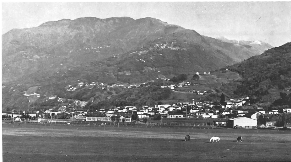
Recente veduta di Camorino.