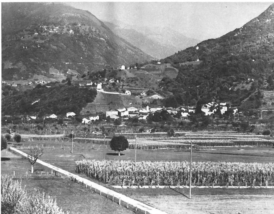
Camorino nel 1939.

Il Comune di Camorino — 805 ettari — confina con Giubiasco, Pianezzo, Isona e S. Antonino. Si stende in parte sul Piano di Magadino — quota 223 s. m. — dove, verso S. Antonino troviamo la frazione di Comelina, salendo sul cono di deiezione formato dal Rial Grande dove troviamo il vec-