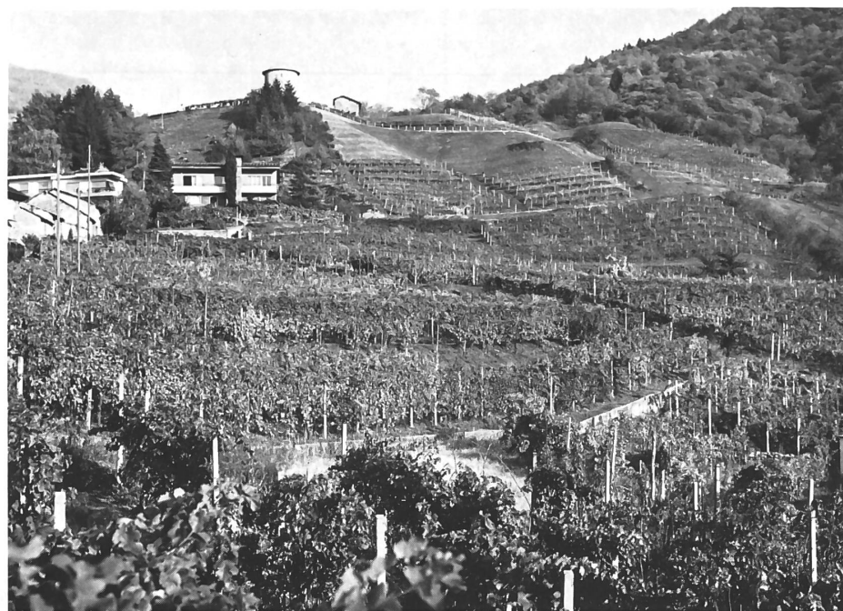
Vigneti di Camorino.