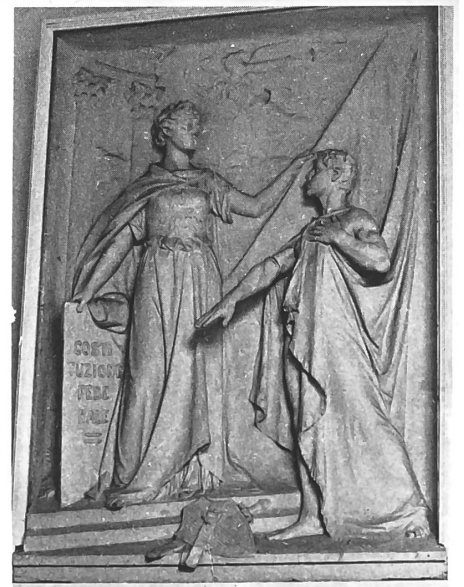
Bassorilievo di Natale Albisetti sul monumento dell'Indipendenza a Bellinzona: La Confederazione accoglie il Ticino.

Non si tratta di qualcosa di monumentale e di invadente; è una presenza discreta e quasi silenziosa, come crediamo anche Natale Albisetti avrebbe gradito. S.M.