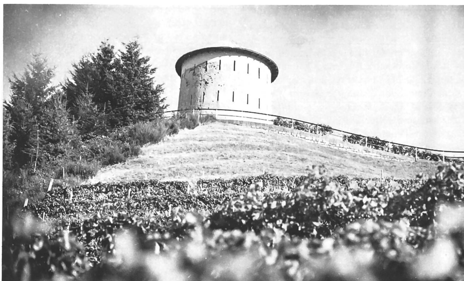
Una delle «torri della fame» ancora conservata.

E sarà proprio questa «immigrazione», strettamente legata alla situazione economica e sociale di tutto il Bellinzonese — industrie di Giubiasco,