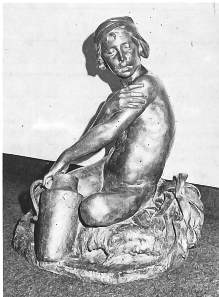
Fontanella in bronzo.