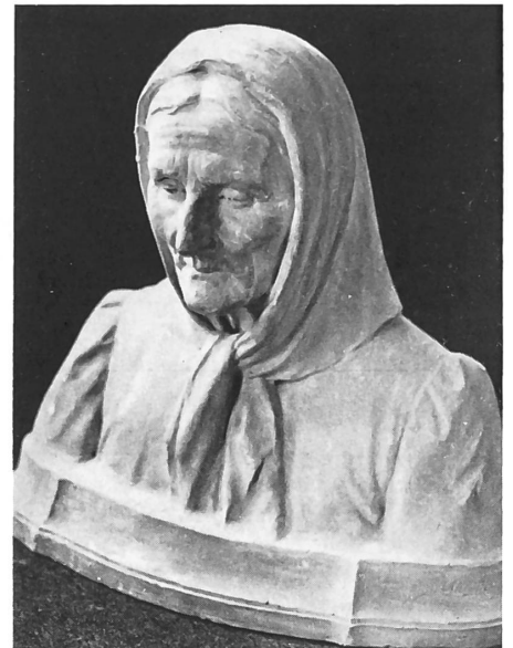
Molto espressivo questo volto di donna (bronzo) di Natale Albisetti.