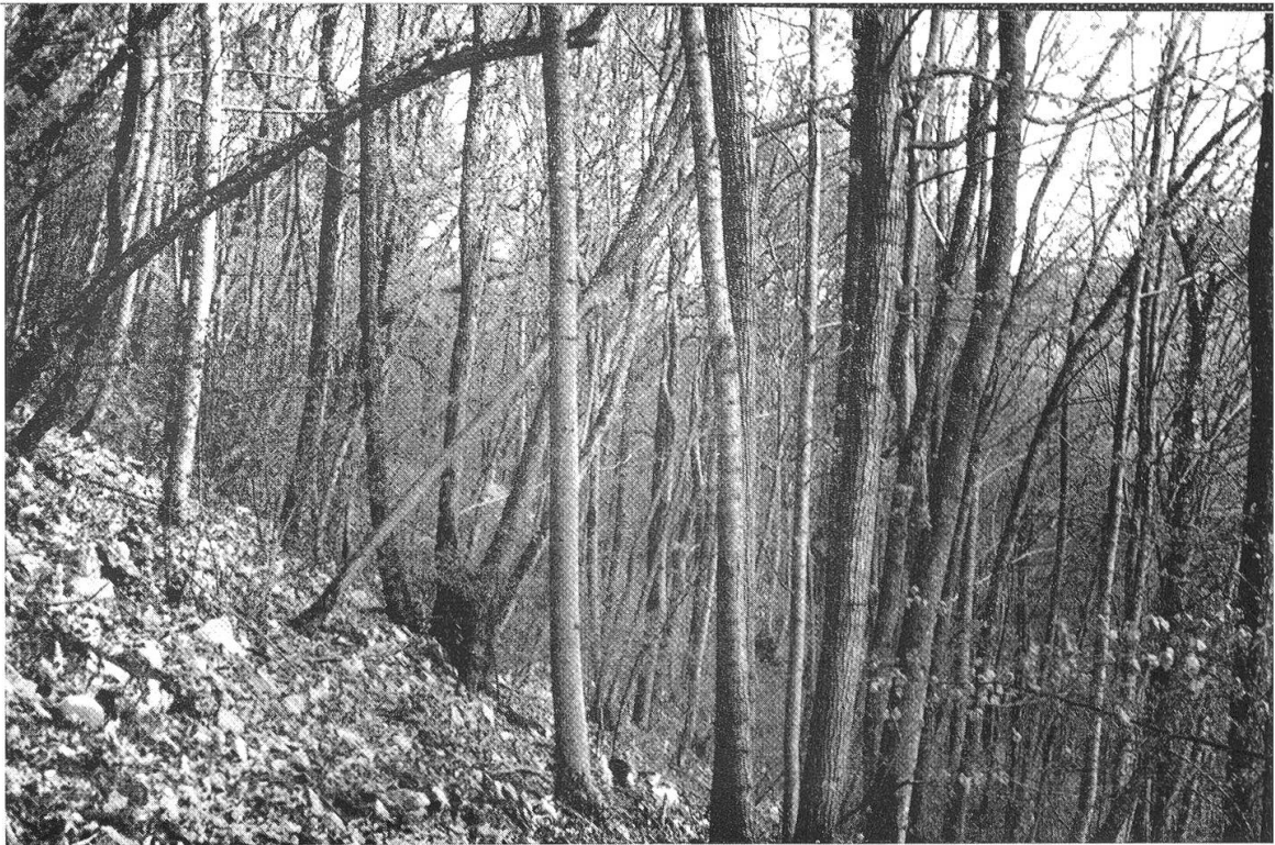
Lindenschwalm (Asperulo-Tilietum, Vegetationsaufnahme 3) Die Linde beherrscht den Bestand