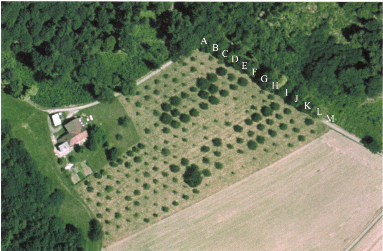
Figure 5.—Photo aérienne du verger en Crépon. A: première ligne du verger; B: seconde ligne, etc. Reproduit avec l'autorisation de swisstopo (BA067857).