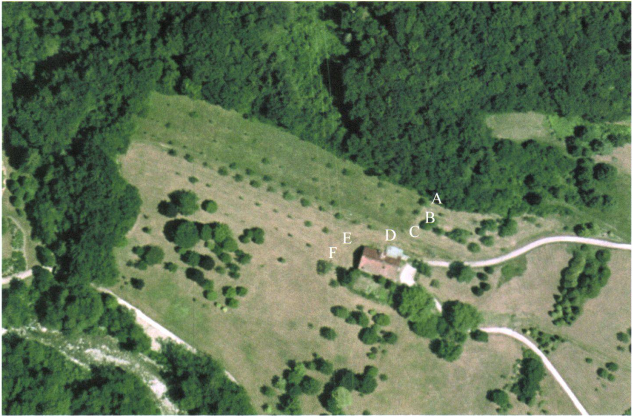
Figure 3.—Photo aérienne du verger en La Vaux. A: première ligne du verger, B: seconde ligne, etc.