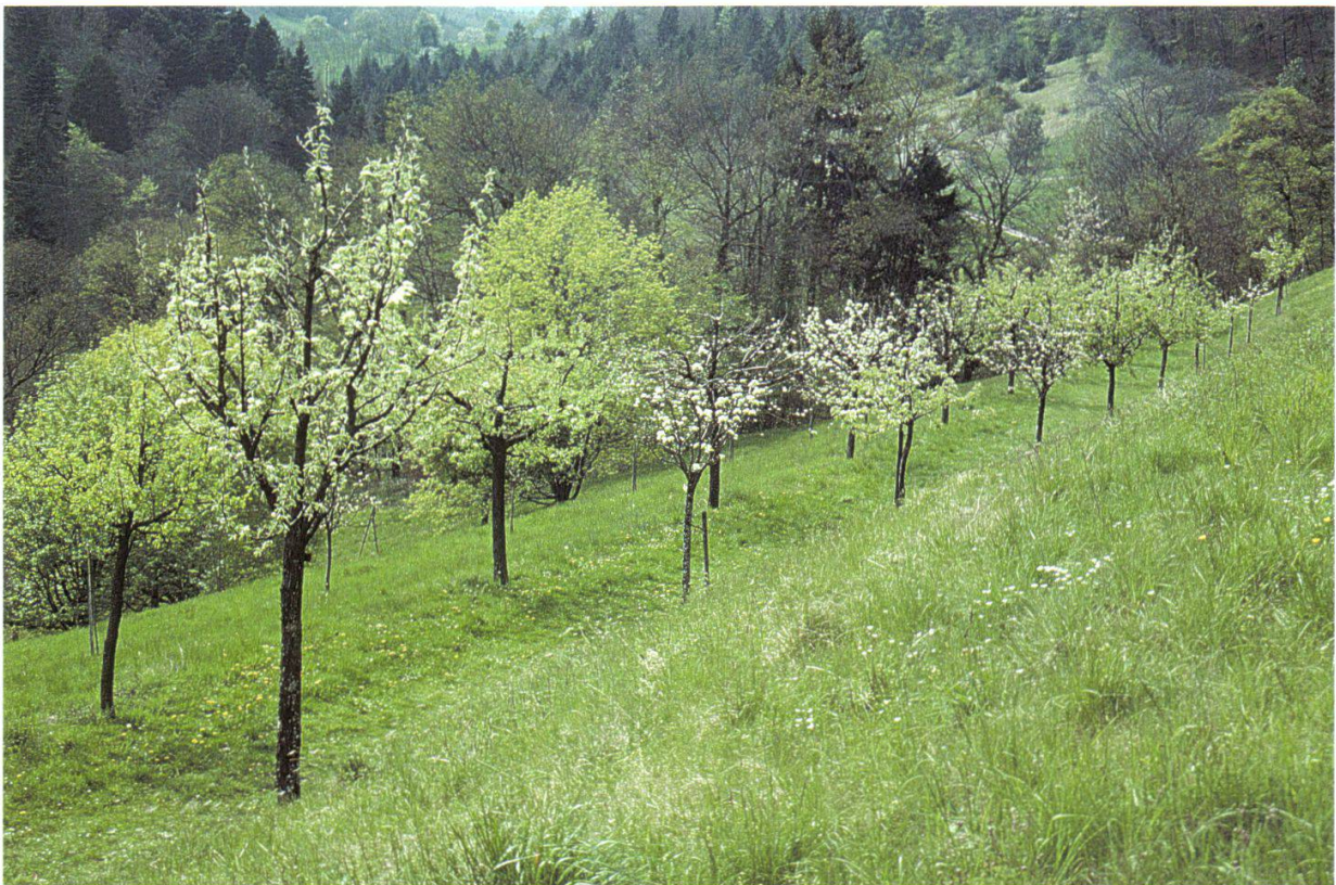
Figure 4.—Allée des poiriers en La Vaux.