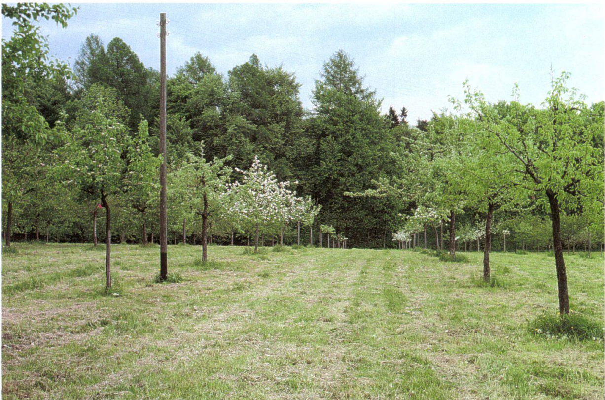
Figure 6.—En Crépon, le plus grands des vergers (2 ha).