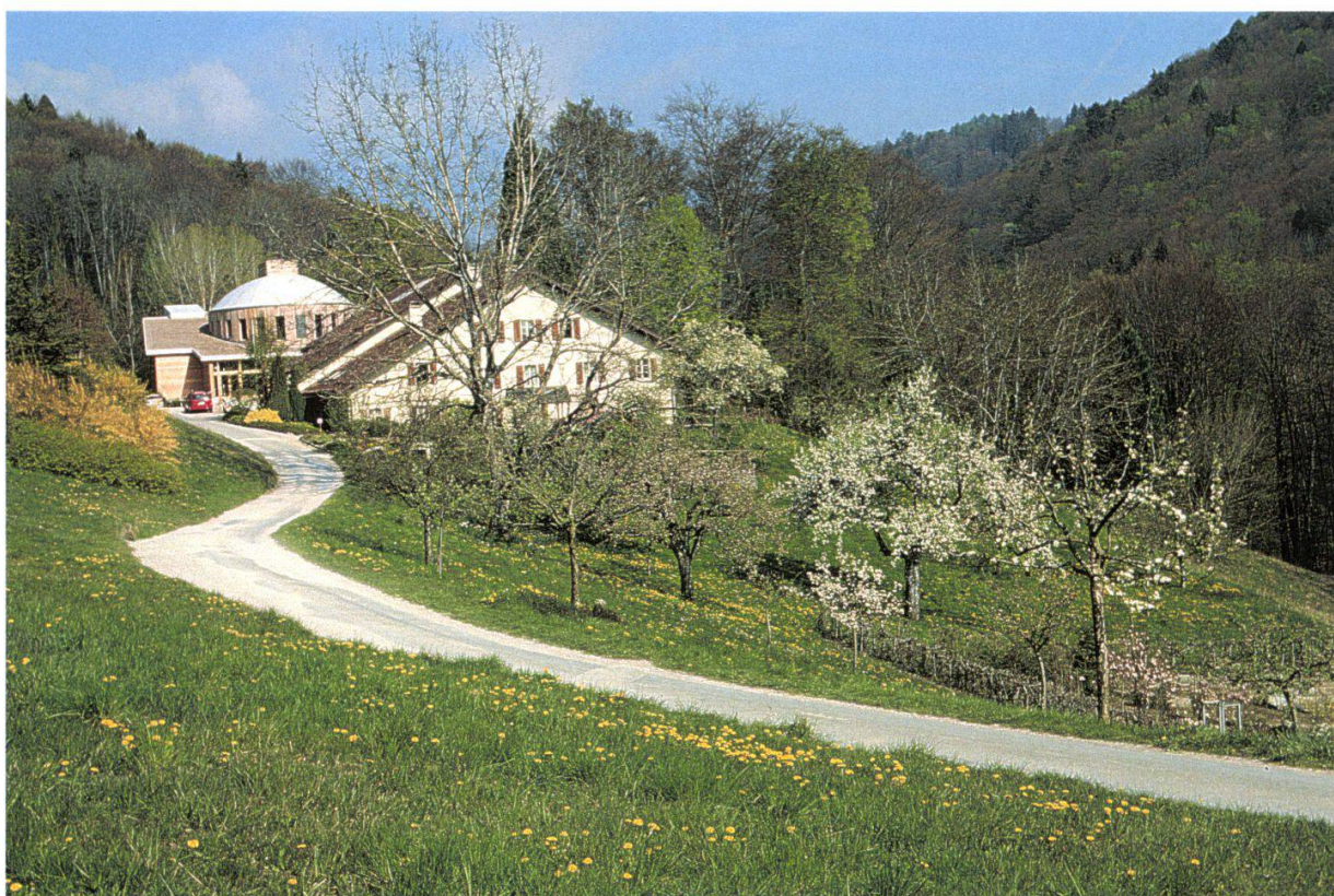
Figure 2.—Verger En Plan; le pommier en fleur pyramidal est le Rambour d'été.

curiosités, comme la pomme «Api étoilé», la «Griotte de la Toussaint» ou le noyer intermédiaire ( Juglans intermedia ) dont le rythme de croissance est stupéfiant.