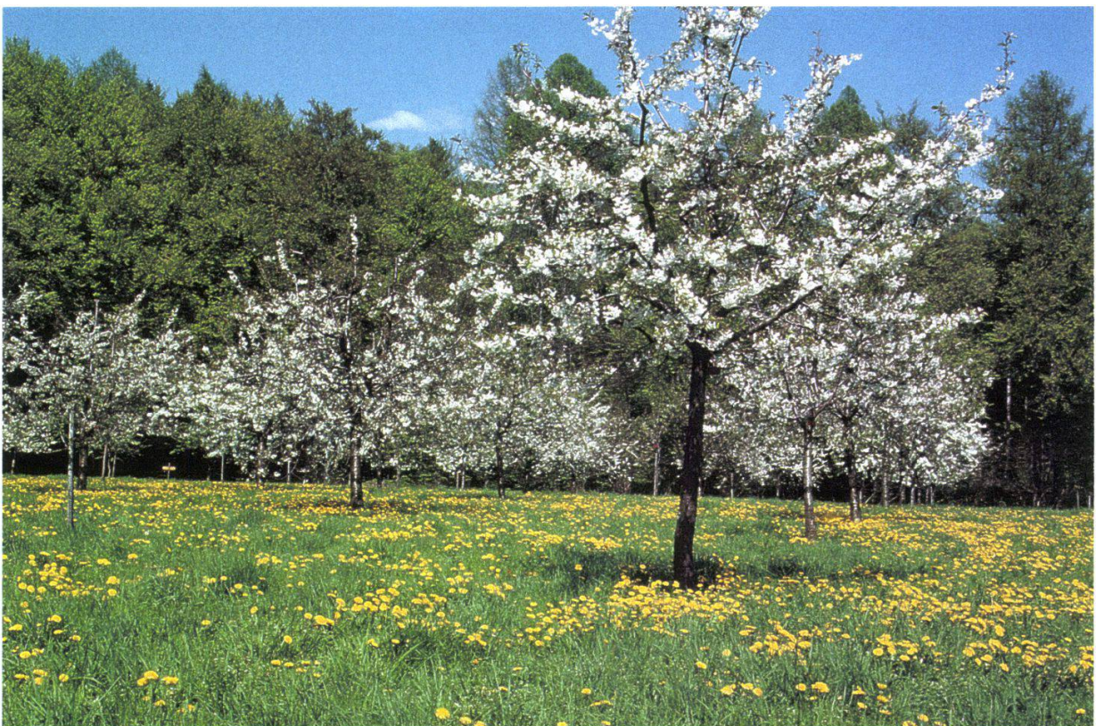
Figure 7.—Cerisiers en Crépon, avril 1999, forme haute tige.

Pour l'environnement, le verger traditionnel en haute tige est plus intéressant que le verger industriel en basse tige. Selon les expériences réalisées par des ornithologues, la surface minimale pour recréer un écosystème «verger haute tige» serait de 3 ha (fig.7). Dans le cadre du Crépon, on y arrive bientôt car, en plus des 2 ha, on peut ajouter en prolongement une allée de 20 cerisiers, la proximité de la forêt, et la parcelle des châtaigniers. Ainsi donc, le verger En Crépon accomplit simultanément deux missions: la collection et le système écologique.