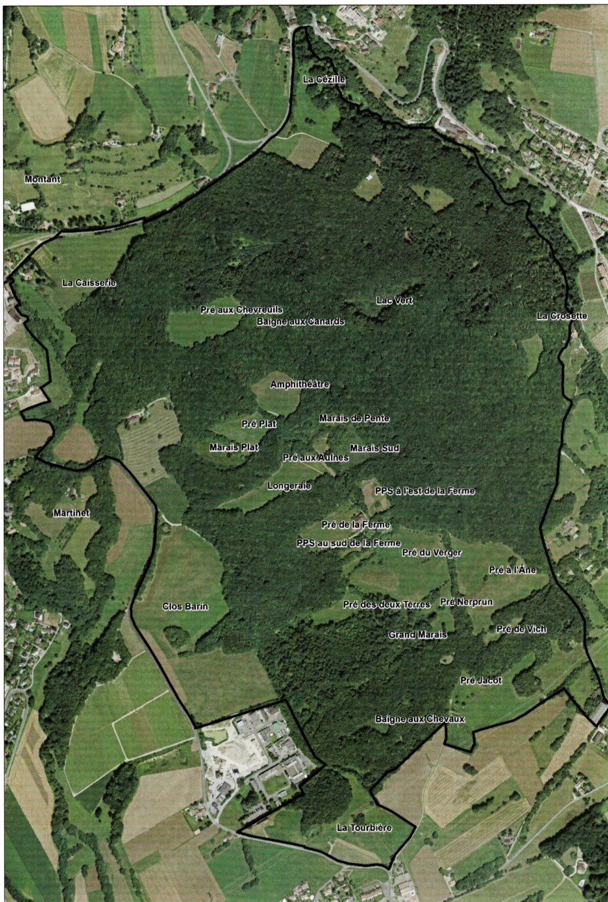
Figure 5. Périmètre d'investigation des Journées de la biodiversité du Bois de Chênes.