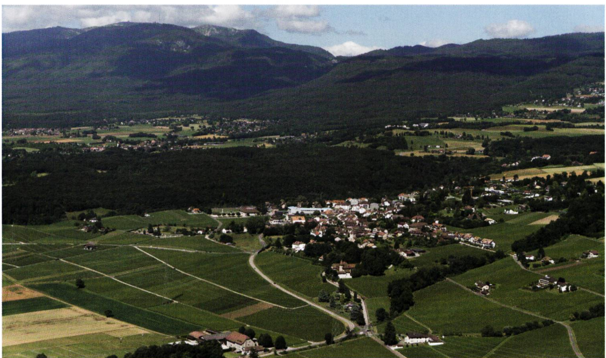
Figure 1. Photos aériennes du Bois de Chênes, entre 1930 et 1950 et le 3 juillet 2016.