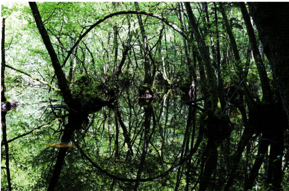
Figure 4. Le lac Vert.

tinosa ), confinée dans quelques cuvettes marécageuses, constitue un des plus précieux joyaux de la réserve (figure 4). Elle est localement accompagnée en lisière de stades pionniers de saulaie ( Frangulo-Salicetum cinereae ) et de taches de bouleau. L'étude arrive à la conclusion que tous ces types de forêt sont dignes de participer à une réserve forestière naturelle. Deux ans plus tard, une réserve forestière mixte verra le jour.