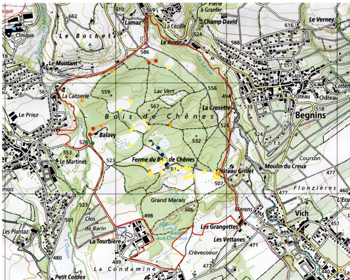
Figure 1. Carte des stations de lichens relevés au Bois de Chênes, avec l'indication du type de milieu. Points rouges: hêtre; points oranges: chênaie à charme; points jaunes: lisière ou arbre isolé dans un milieu ouvert; points bleus: milieux humides; points verts: allée de pins; points gris: substrats rocheux. Le périmètre d'étude figure en rouge.

Tableau 1. Liste des espèces de lichens relevées au Bois de Chênes, avec mention de la catégorie de liste rouge. LR CH - catégories au niveau national; LR Plateau - catégories au niveau du Plateau, avec les catégories suivantes: EN (en danger), VU (vulnérable), NT (quasi menacé), LC (préoccupation mineure) (SCHEIDEGGER & CLERC, 2002). Prio - espèces prioritaires au niveau national selon l'OFEV (2011) avec les catégories suivantes: 3 (priorité moyenne), 4 (priorité faible). Espèces considérées d'intérêt pour le canton de Vaud: IR - intérêt régional, ISR - intérêt supérieur régional (REC-VD, 2012), RPF - Espèces considérées comme rares ou menacées dans l'annexe du règlement cantonal concernant la protection de la flore du 2 mars 2005 (RPF). Vieux arbres - espèces prioritaires liées aux vieux arbres, selon SCHEIDEGGER & STOFER (2009). Nouveau VD: espèces mentionnées pour la première fois dans le canton de Vaud, en référence avec le Catalogue des lichens de Suisse (CLERC & TRUONG, 2012).