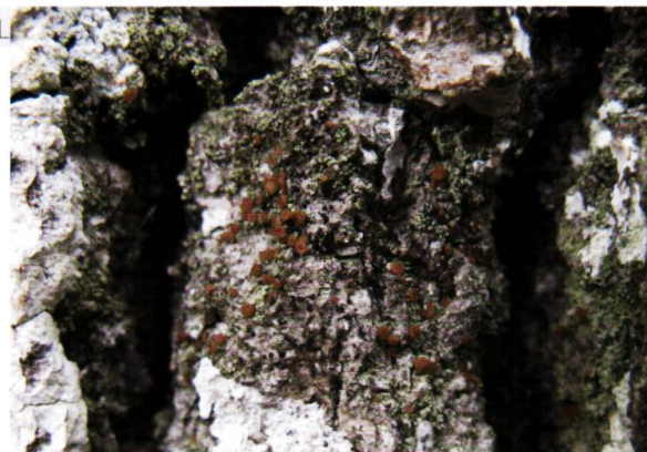
Figure 3. Bacidia rubella , espèce caractéristique de l'alliance de l'Agonimion octosporae rassemblant les espèces crustacées neutrophiles sur écorce rugueuse et ombragée.