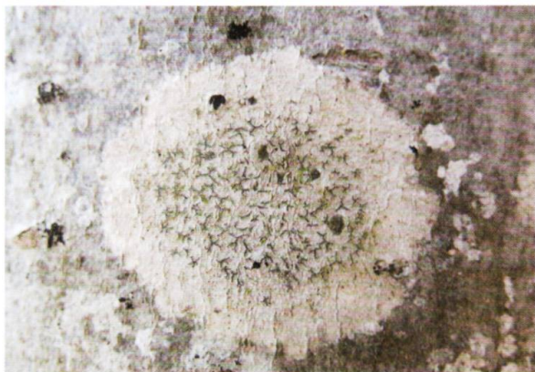
Figure 2. Graphis scripta , espèce caractéristique de l'alliance du Graphidion scriptae , rassemblant les espèces crustacées neutrophiles sur écorce lisse et ombragée.