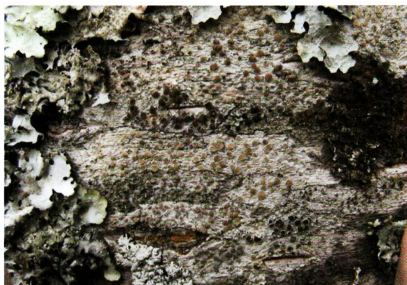
Figure 8. Tronc exposé à la lumière, colonisé par les espèces crustacées du genre Lecanora et bientôt recouvertes par les espèces foliacées du Xanthorion parietinae.