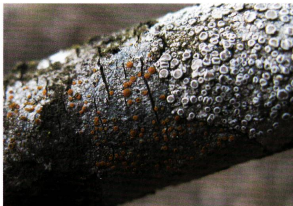
Figure 7. Branche colonisée par les petites espèces pionnières du Lecanorion subfuscae ; fructifications rouges: Caloplaca ferruginea ; fructifications gris clair: Lecanora carpinea.

exposé à la lumière, est colonisé par de nombreuses autres espèces de lichens, retrouvées notamment sur le tronc des arbres en lisière (voir plus loin). Ce que les lichénologues soupçonnaient sur le terrain en observant ces branches tombées au sol vient d'être démontré pour les érables isolés des pâturages du nord des Alpes: une grande proportion des espèces de lichens ne se trouve que dans la couronne des arbres (61 % en moyenne par arbre et 34 % sur l'ensemble des arbres étudiés). Plus encore, la plupart des espèces menacées de lichens ont été trouvées plus fréquemment dans la couronne que sur le tronc (KIEBACHER et al. 2016). Il serait donc essentiel de pouvoir appréhender la diversité des lichens de la couronne des arbres dans les études de biodiversité comme celle-ci ou lors de l'édification des listes rouges. Faute de temps et de moyens techniques adéquats, c'est l'étude des arbres en lisière ou isolés en milieu ouvert qui a remplacé celle des couronnes.