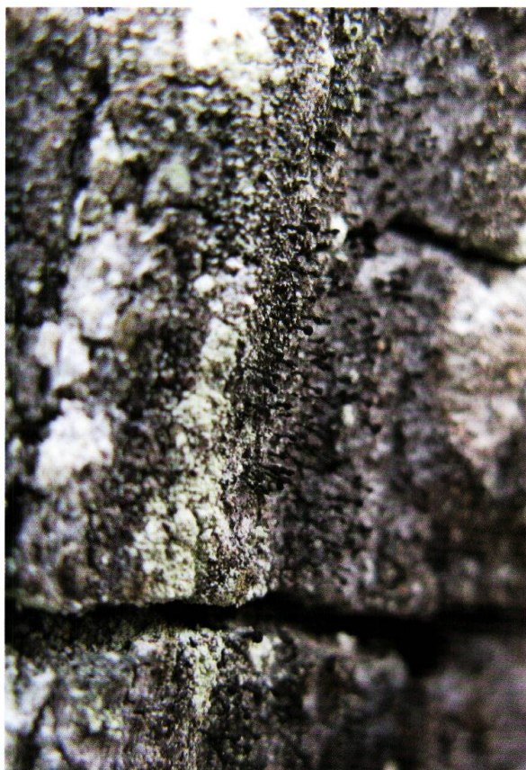
Figure 15. Calicium glaucellum , une espèce du groupe des Caliciales caractérisées par leur fructifications ressemblant à de petits clous et colonisant le bois mort à l'abri de l'influence directe de la pluie.