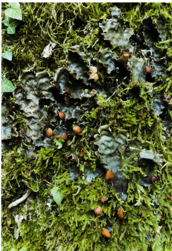
Figure 4. Peltigera horizontalis croissant sur la mousse du pied d'un arbre.