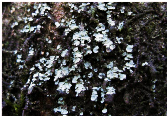
Figure 6. Normandina pulchella , minuscule lichen corticole forestier trouvé parmi les hépatiques à feuilles sur l'écorce lisse des charmes.