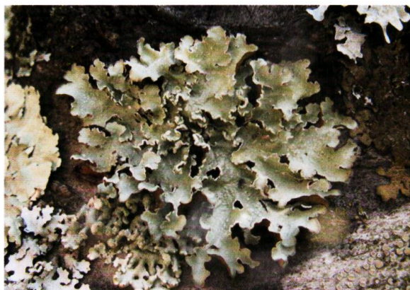
Figure 9. Punctelia jeckeri , un représentant de l'alliance du Pleurostiction acetabuli rassemblant les espèces foliacées colonisant les écorces exposées à la lumière et un peu acides, comme ici sur un cerisier.