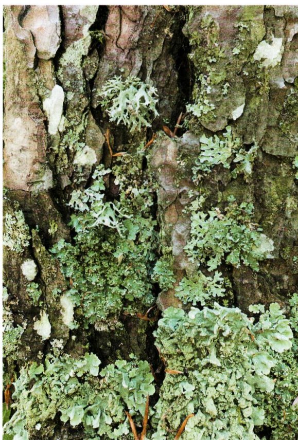
Figure 11. Détail de l'écorce d'un pin, colonisée par les espèces acidophiles, telles Pseudevernia furfuracea , Parmelia sulcata , Punctelia jeckeri et Flavoparmelia caperata (de haut en bas).

substrats nettement influencés par l'eutrophisation, alors que c'est moins le cas pour les espèces du Pleurostiction acetabuli (N = 5,1). Le reste des espèces (N = 4,2), aussi bien que les espèces du Pseudevernia furfuracea (N = 3,5), signent quant à elles des substrats peu influencés par l'eutrophisation.