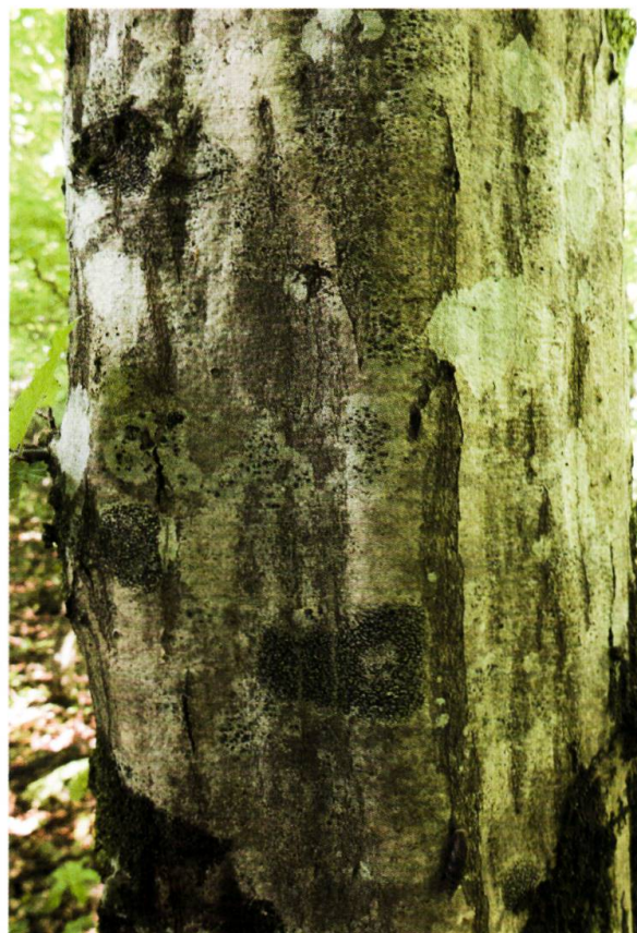
Figure 5. Ecorce de charme avec quelques espèces du Graphidion scriptae , notamment Arthonia atra au centre, en bas (photo: Mathias Vust).

l'écorce du hêtre (BARKMAN 1958). L'indice d'eutrophisation (N) moyen de 2,6 correspond à une situation très peu influencée par l'eutrophisation, ce qui est attendu de stations de pleine forêt, éloignées des surfaces engraisées.