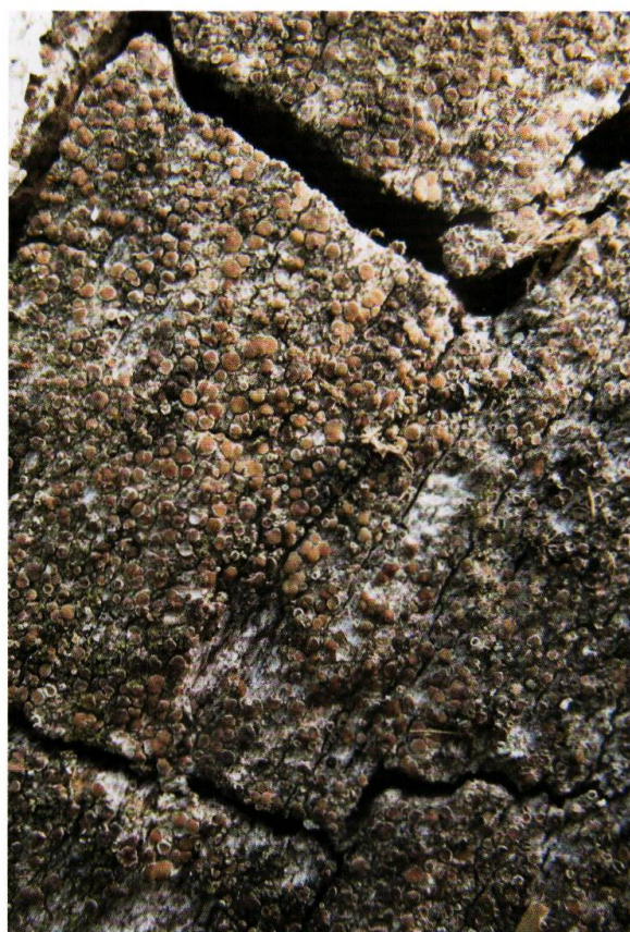
Figure 16. Lecanora saligna , une espèce crustacée typique des premiers stades de la colonisation du bois mort; ici sur un vieux cerisier.