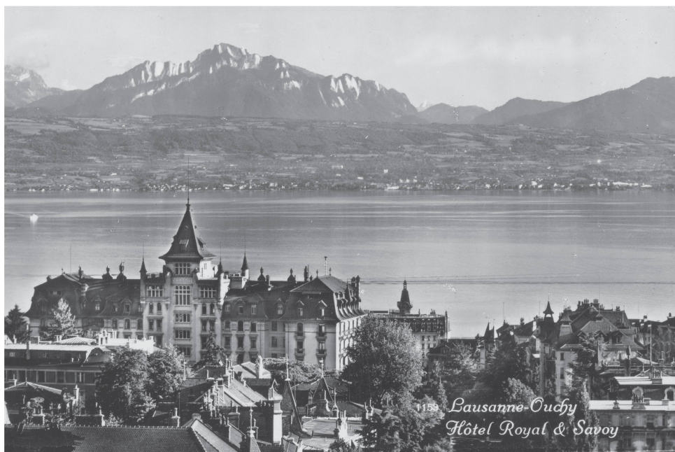
7 L'Hôtel Royal & Savoy vers 1940.