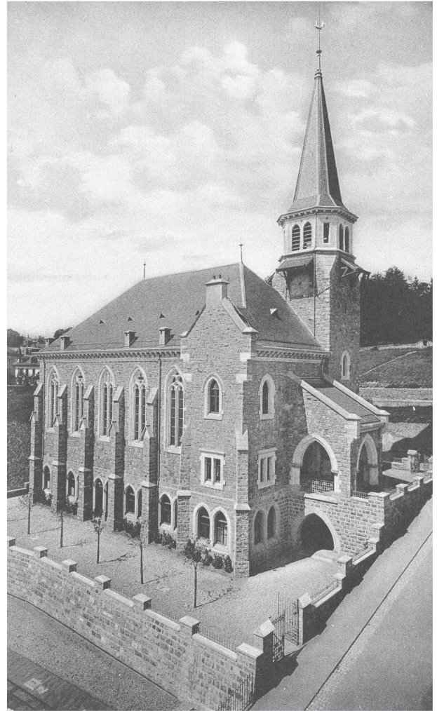
5 Carte postale de l'église Saint-Paul à l'avenue de France, vers 1915.