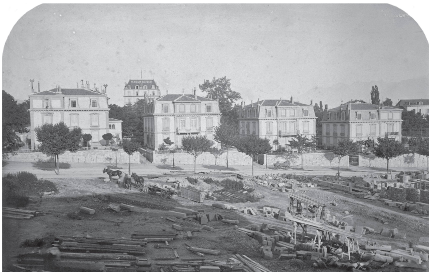
3 Vue photographique des villas locatives de l'avenue Georgette, vers 1875 (MHL).

hôpitaux, des écoles ou des hôtels. Ses deux premières collaborations, avec son père et avec Henri Boisot, restent méconnues. Néanmoins, avec ce dernier, il s'occupe notamment de la transformation du théâtre de Martigny en chapelle en 1862 29 , ainsi que de la restauration de l'église de Saint-François 30 .