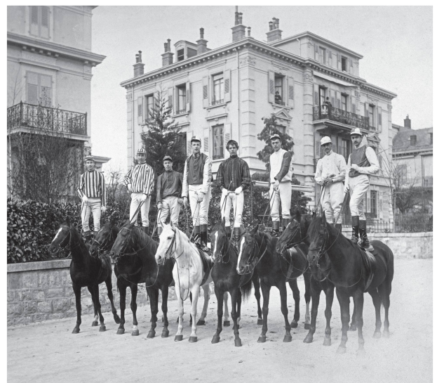
6 Groupe de cavaliers posant sur leurs chevaux devant la villa locative de l'avenue Églantine 8, vers 1905.