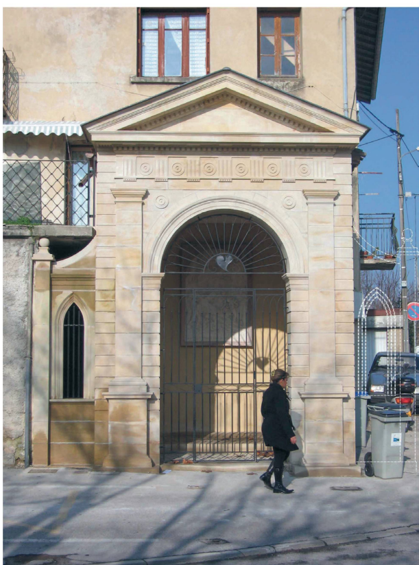
1 Grand Voyage de Romans-sur-Isère (Drôme - France), station XXI. État de l'oratoire avant et après travaux.

Pilate, l'hôtel de ville est le palais d'Hérode, les stations du jardin de Gethsémani sur la colline appelée Montalivet, le cimetière de l'ancien couvent des Récollets est le mont Calvaire hors les murs, etc.).