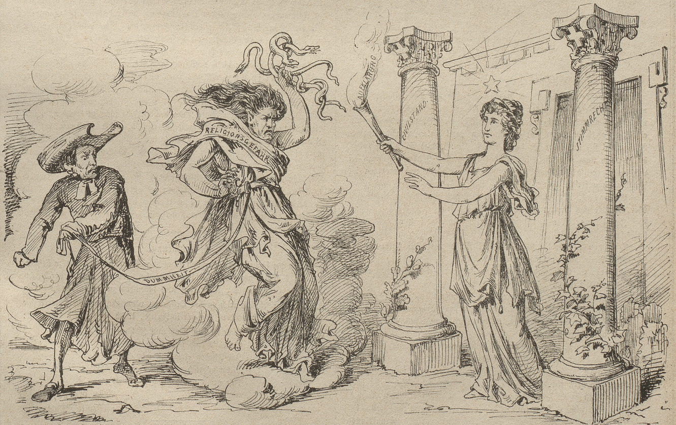
Das beliebte Ungeheuer „Religionsgefahr“ wird von seinen Erzeugern neuerdings gegen zwei Säulen unsers Neubaus in's Feld geführt. Wer mitgeht, erhält unbedingten Ablaß!

An ihren Früchten sollt ihr sie erkennen!