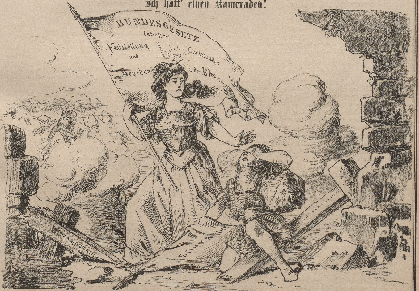
„Ihn hat es weggerissen, er liegt zu meinen Füßen, als wär's ein Stück von mir!“