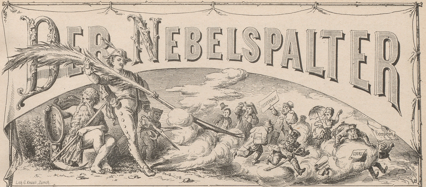
Lith. G. Knüschli, Zürich.