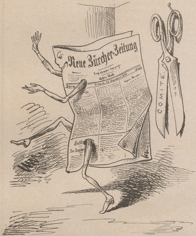
Neue Zürcherzeitung: Mir ist's wohl!