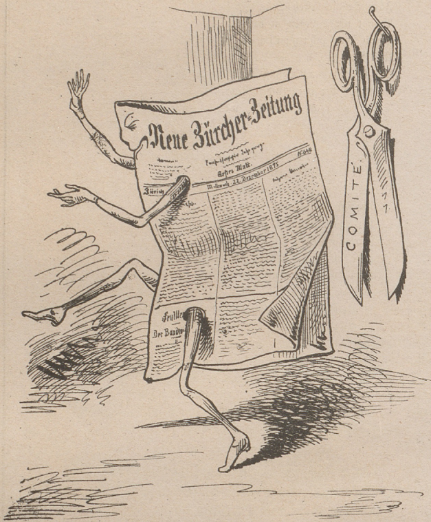
Neue Zürcherzeitung: Mir ist's wohl!