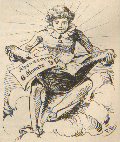
Wird doch der „Rebelspalter“ abonniert.