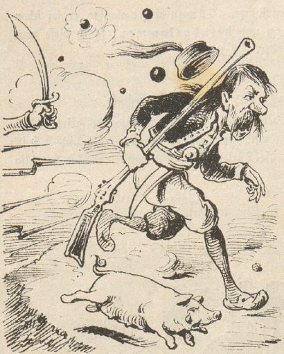
Die weil die Serben durch man schmiert,