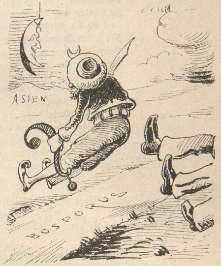
Den armen Sultan ermittelt,