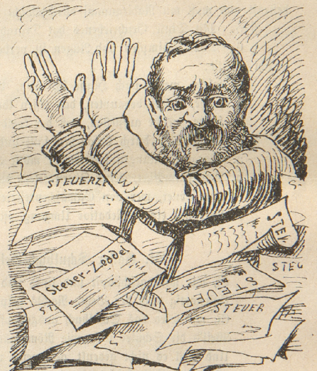
Die Steuerzahler maltrahirt,