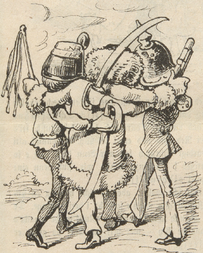
In Reichsstadt blödl'ich wird allirt,