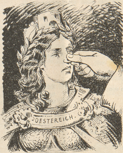
Und Oest'reich an der Nas' rumführt,