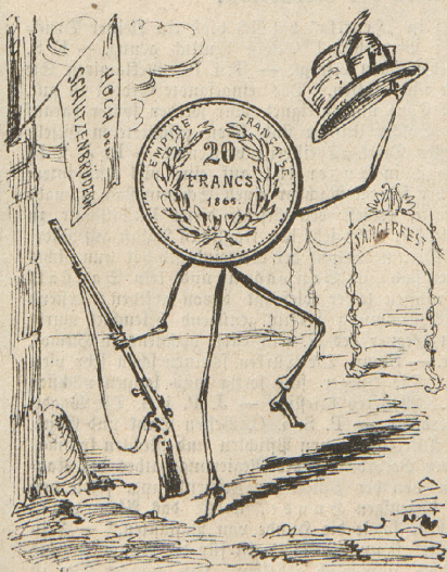
Das schönste Geld verjubilirt