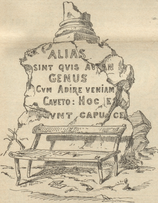
(Auflösung folgt in nächster Nummer).

In der Nähe von Brugg steht ein großer halb zerstörter Felsblock, wahrscheinlich die Ueberreste eines römischen Castells. Auf der einen glatten Wand ist eine Inschrift eingemeißelt, von welcher jedoch offenbar der größere Theil fehlt und der Rest sehr beschädigt ist. Aus dem Vorhandenen zu schließen, dürften schätzenswerthe Aufschlüsse über die Beschäftigung der damaligen Bevölkerung darin enthalten sein. Wer vermag den Sinn zu enträthseln?