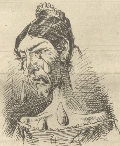
Sch weiß nicht, was soll es bedeuten, Daß ich so traurig bin.

Auflösung der „räthselhaften Inschrift“ in letzter Nummer: „Der Hof (Kind) ist eiser (immer), i sch ihn afe-ne-mol au do Wy suffe.“